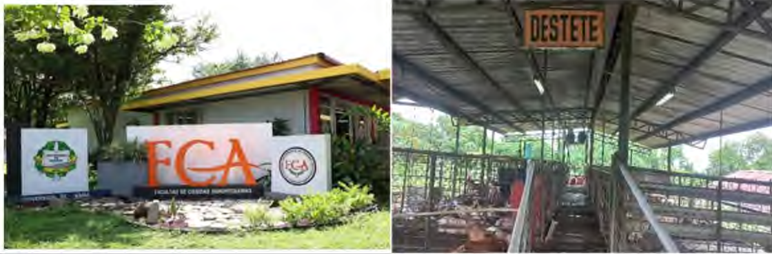
Figura 1. Facultad de Ciencias Agropecuarias, módulo de producción porcina.

El estudio se realizó en el módulo porcino de la Facultad de Ciencias Agropecuarias, ubicada en el corregimiento de Chiriquí, distrito de David, provincia de Chiriquí, localizada en las coordenadas 8°24'0" Norte, 82°19'12" Oeste (figura 1).