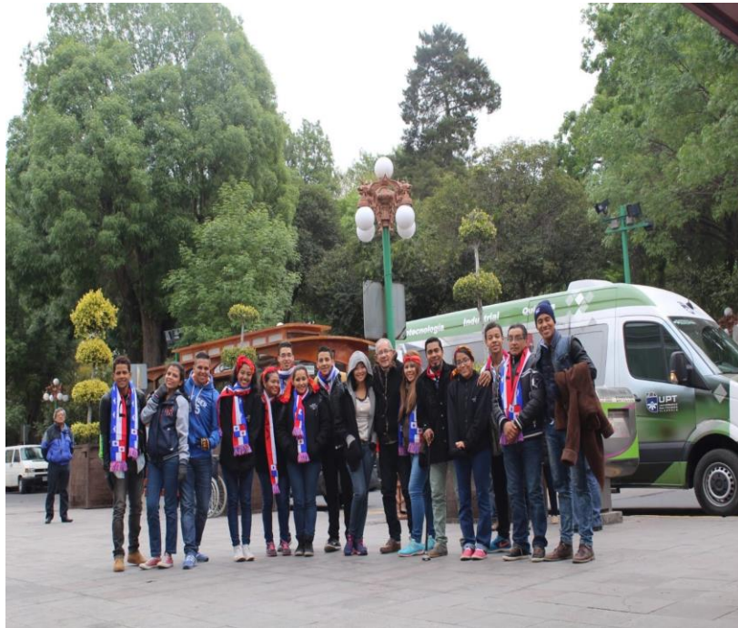
Imagen 14: festival de folklore en México.