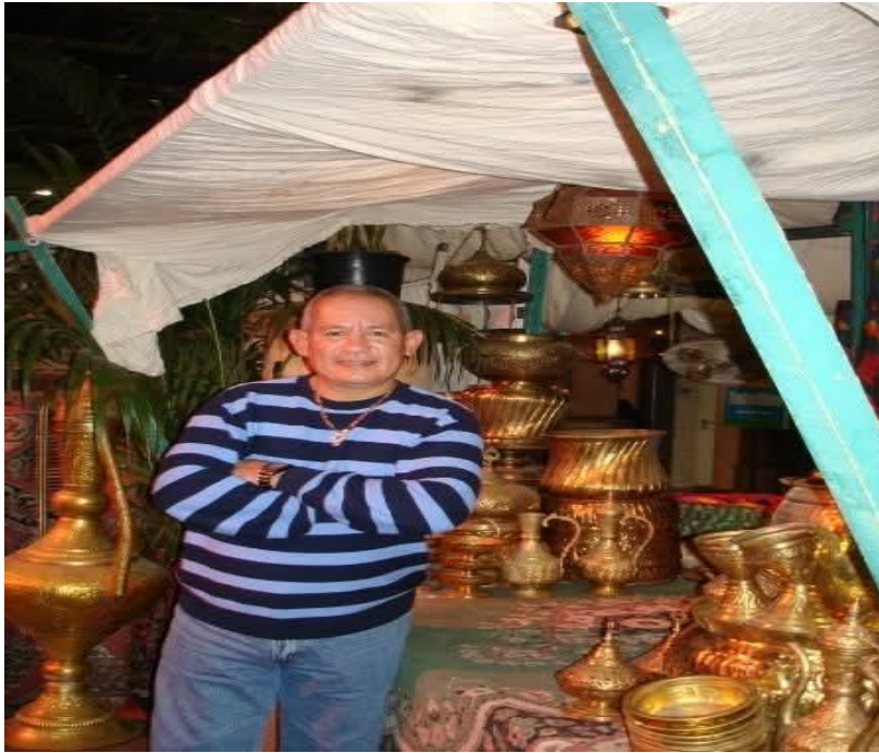
Imagen 18: festival folklórico en España.