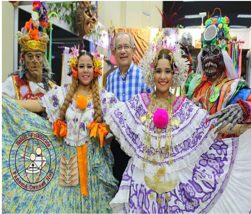
Imagen 16: reconocimiento en la semana de la danza.