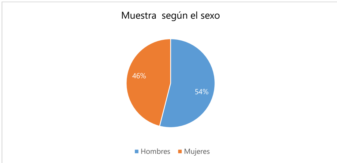
Gráfica 1. Muestra según sexo.