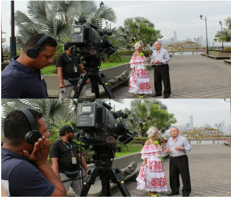
Imagen 12: festival de folklore en Puebla, México.