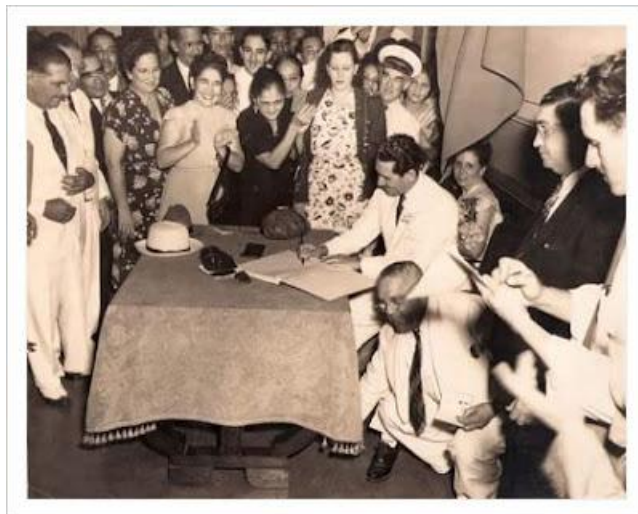
Título: Nombramiento de la primera mujer ministra de Estado en Panamá

La culminación de este proceso de institucionalización, y su evento de mayor resonancia simbólica, fue el ascenso de María Santodomingo de Miranda como Ministra de Trabajo y Previsión Social en 1950, nombrada por el presidente Arnulfo Arias Madrid. Este hecho la convirtió en la primera mujer en ocupar la jefatura de un ministerio en Panamá y, según varias fuentes, la primera ministra de Estado en toda América Latina. Imagen No. 1