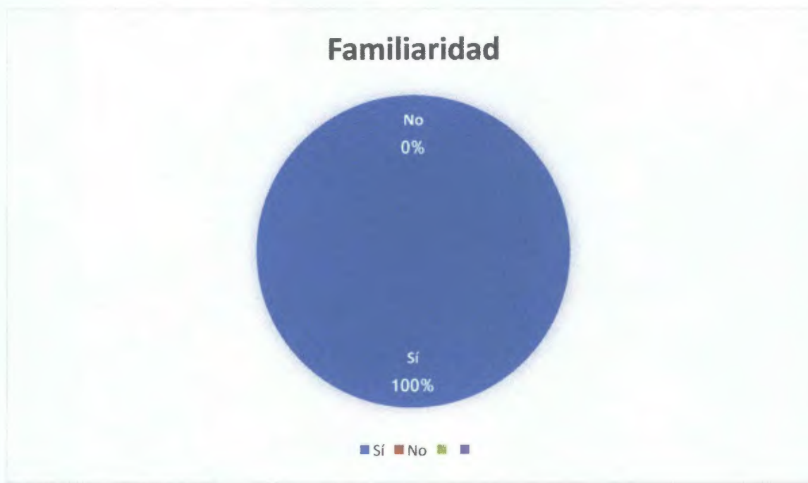
Grafico N° 3: Familiaridad de los encuestados con el termino sustitución de la pena de prisión.