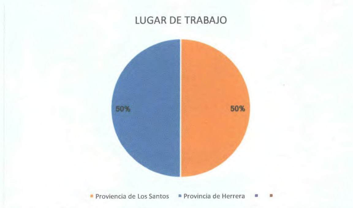
Grafico N° 2: Distribución de la encuesta según el lugar de trabajo.