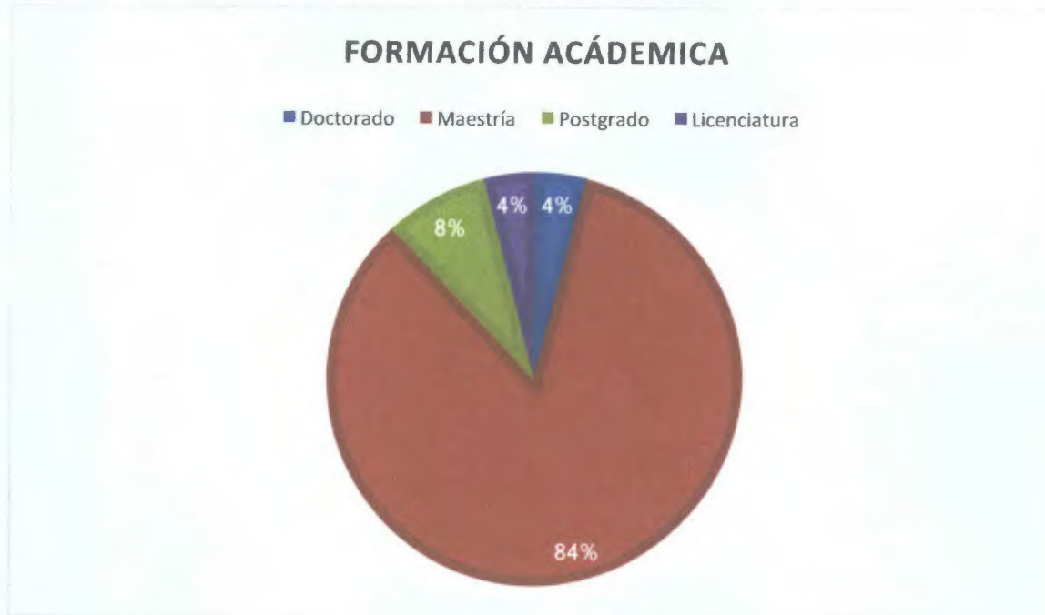
Gráfico N° 1: Distribución de la Formación Académica: