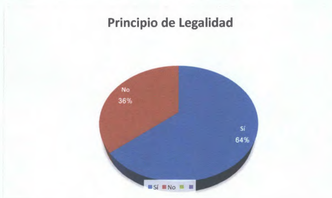
Gráfica N° 5: Distribución de la opinión de los encuestados sobre la aplicación del Principio de legalidad por los Jueces ante la sustitución de la pena de prisión.