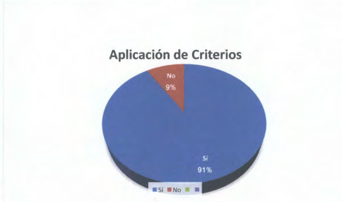
Gráfico. N° 10: Distribución de los encuestados sobre si consideran que los jueces deben tomar en cuenta ante la sustitución de la pena de prisión los siguientes criterios: Pena, Tipo de delito, Condiciones fisiológicas, Condiciones socioeconómicas, Seguridad, Comportamiento del sancionado y Resarcimiento de la víctima.