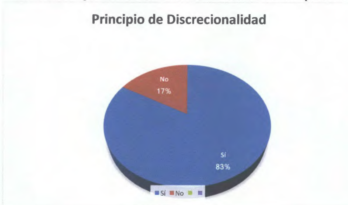
Tabla N° 6: Distribución de la opinión de los encuestados sobre la aplicación del Principio de Discrecionalidad por los Jueces ante la sustitución de la pena de prisión