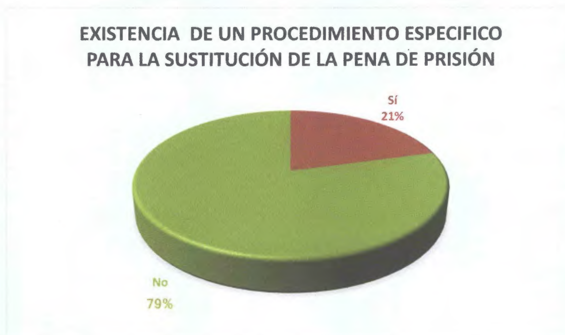
Gráfico N° 4: La Ley 63 del 2008 y el Código Penal de Panamá, establecen un procedimiento específico para la sustitución de la pena de prisión