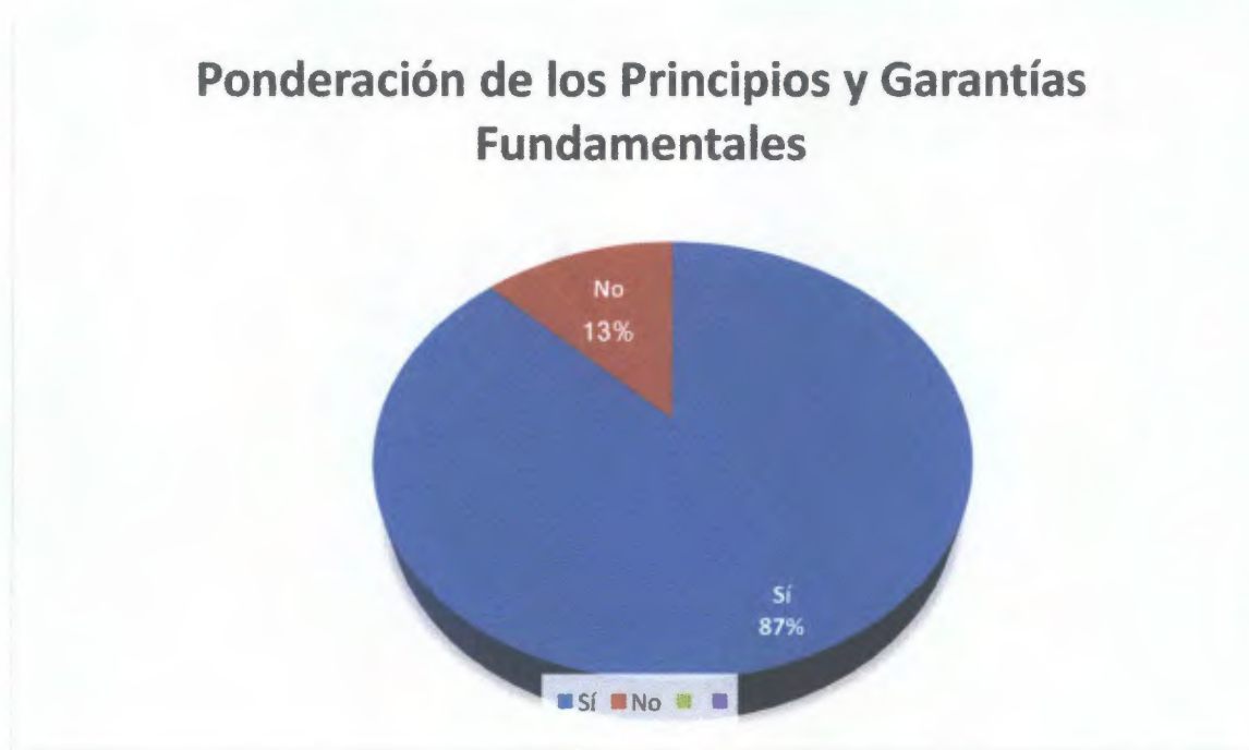
Gráfico N° 8: Distribución de la opinión de los encuestados, en cuanto a que sí consideran que los jueces ante una solicitud de sustitución de pena de prisión, ponderan los Principio y Garantías fundamentales que establece la Ley 63 del 2008.