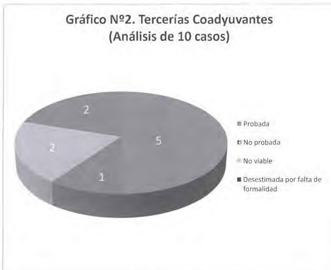
Gráfico N°2. Tercerías Coadyuvantes (Análisis de 10 casos)