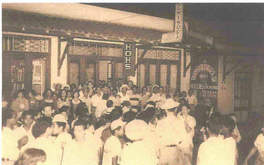
Fig. 5: El pueblo santiagueño frente a la emisora Ondas Centrales. Año 1952.