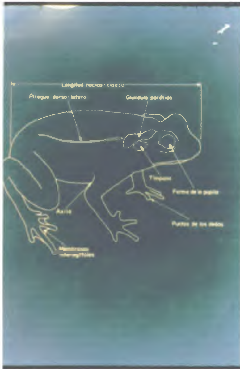
Foto 3. Esquema de una rana, con sus partes morfológicas indicadas.