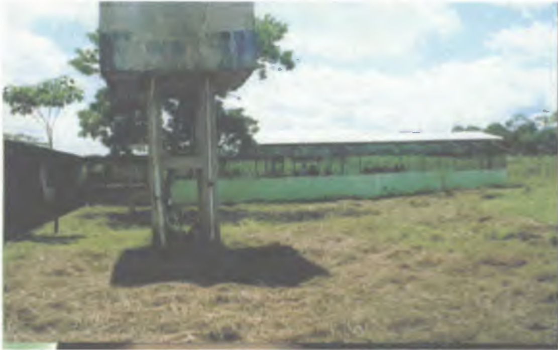
Foto 12. Vista externa de la construcción de estanques piscícolas adaptados para la cría de ranas. Se observa el tanque de agua necesario para la cría. Estación experimental del MIDA, Panamá.

Inicialmente, analizaremos las principales características a ser observadas en el agua que irán a decidir en la instalación de un criadero. Es preciso, en este caso, considerar que en el agua pueden ser captados los siguientes factores: naturaleza de suelo, transparencia, temperatura oxígeno disuelto (OD), pH y sales disueltas.