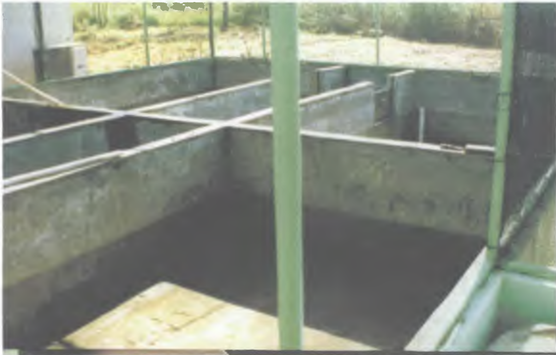
Foto 8. Construcción de una galera de engorde bajo techo de un ranario en Mérida, Yucatán, México.

Confinamiento es el local donde los animales van a permanecer por un determinado período para engorde, en base de 70 animales por m 2 .