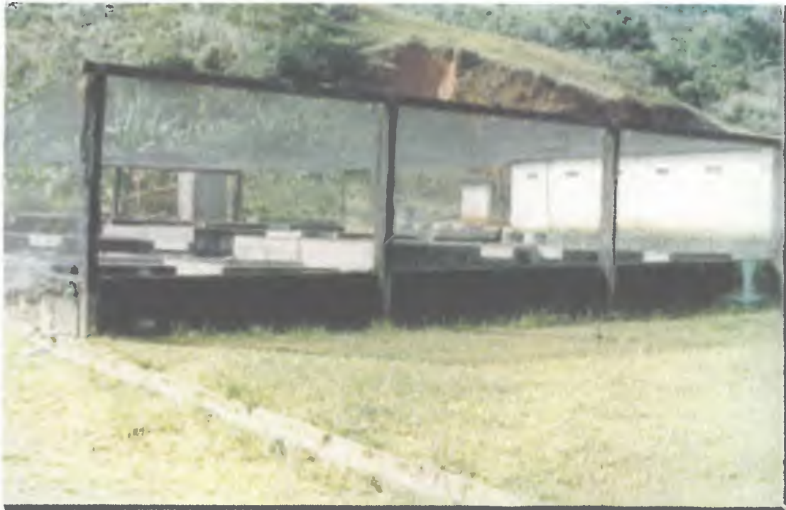
Foto 6. Vista externa del criadero, donde se observan las mallas de aislación y sombra, y las construcciones del matadero de la finca. Criadero en Mérida, Yucatán, México.