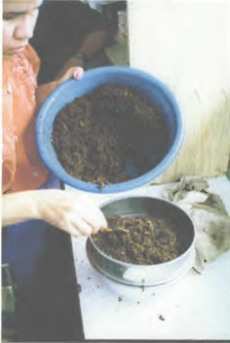
Foto 1. Preparación de alimento para las ranas. Se separa la cama de afrecho de las larvas, utilizando un cernidor. Estación experimental del MIDA, Panamá.