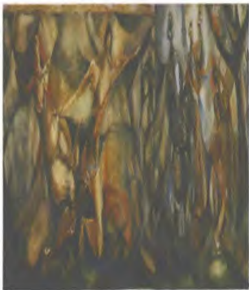
ORO COQUE Y RIESE MONTAÑA DE COQUE, LA SOLUCIÓN HISTÓRICA DE PIVANÍ (paseo) 1984, óleo sobre tela 40" x 30", colección de Cédric Poiré