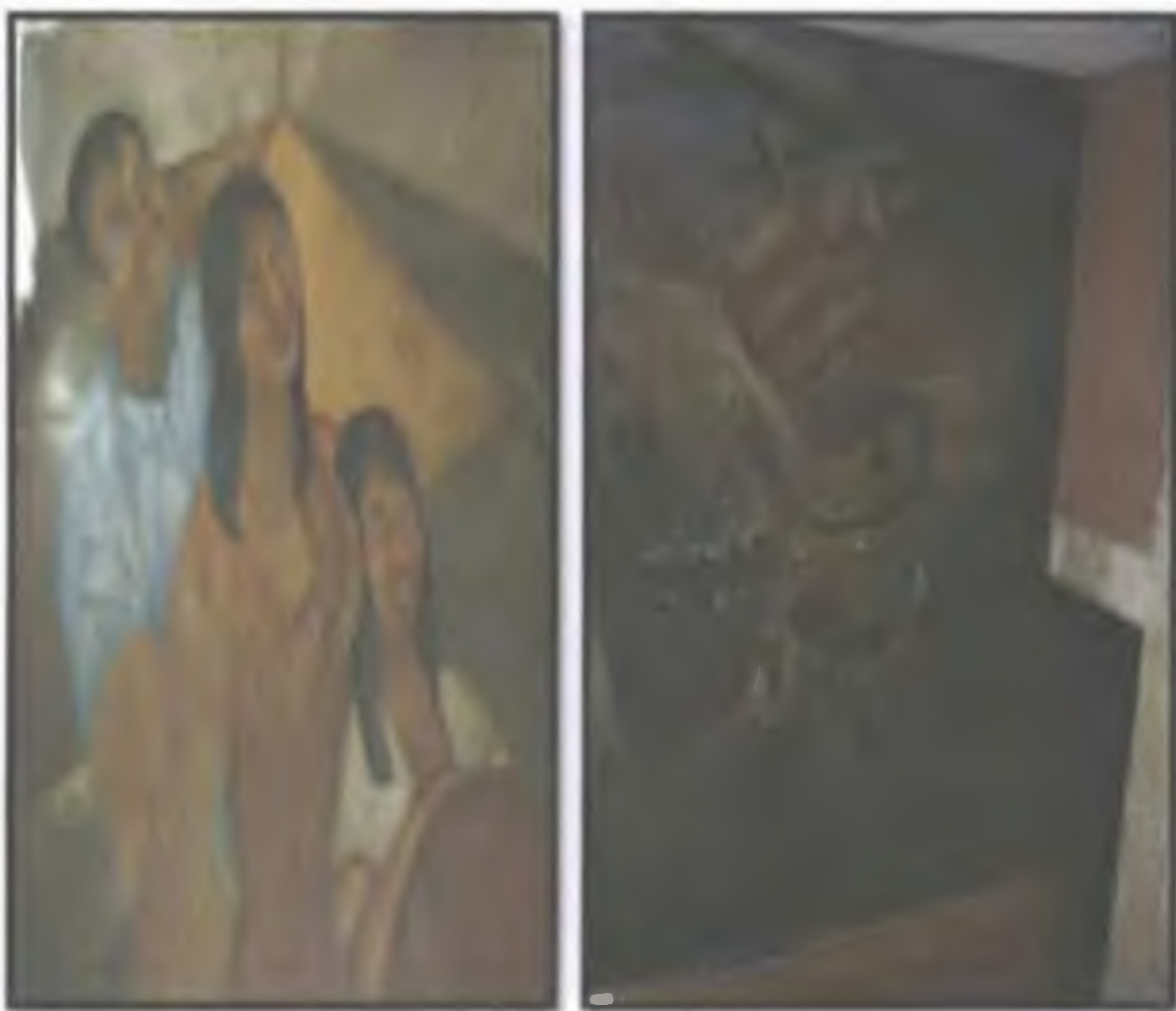
Detalle de la pintura tipo mural del artista Oduber , ubicada en la Caja de calle 17, Santa Ana. La mano monumental que asegura una flecha de los muralistas mexicanos específicamente a Siqueiros