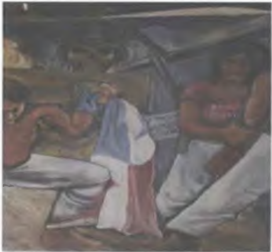
CEMOAR, MANAGUA, NICARAGUA