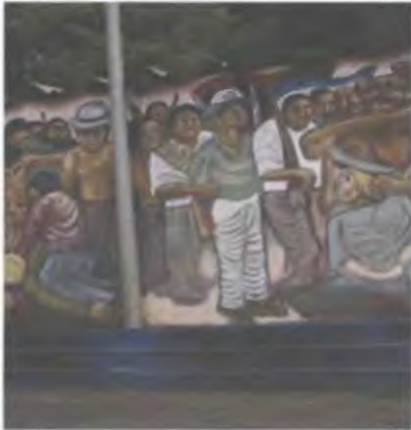
ACADEMIA DE POLICÍA DE MANAGUA, NICARAGUA