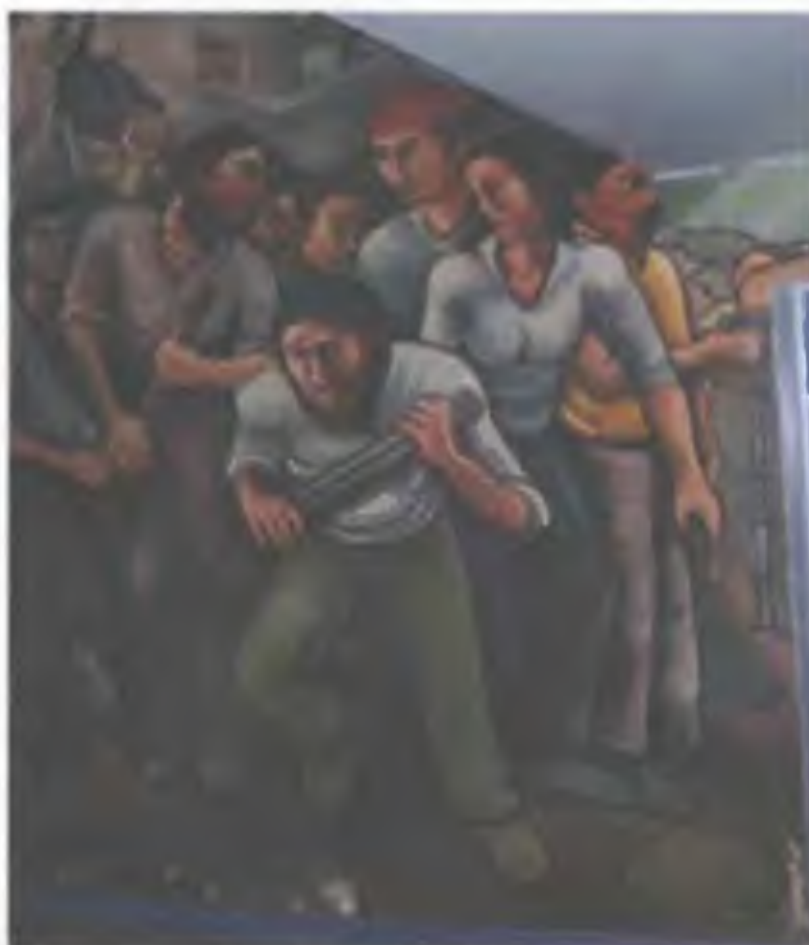
ACADEMIA DE POLICÍA , MANAGUA, NICARAGUA