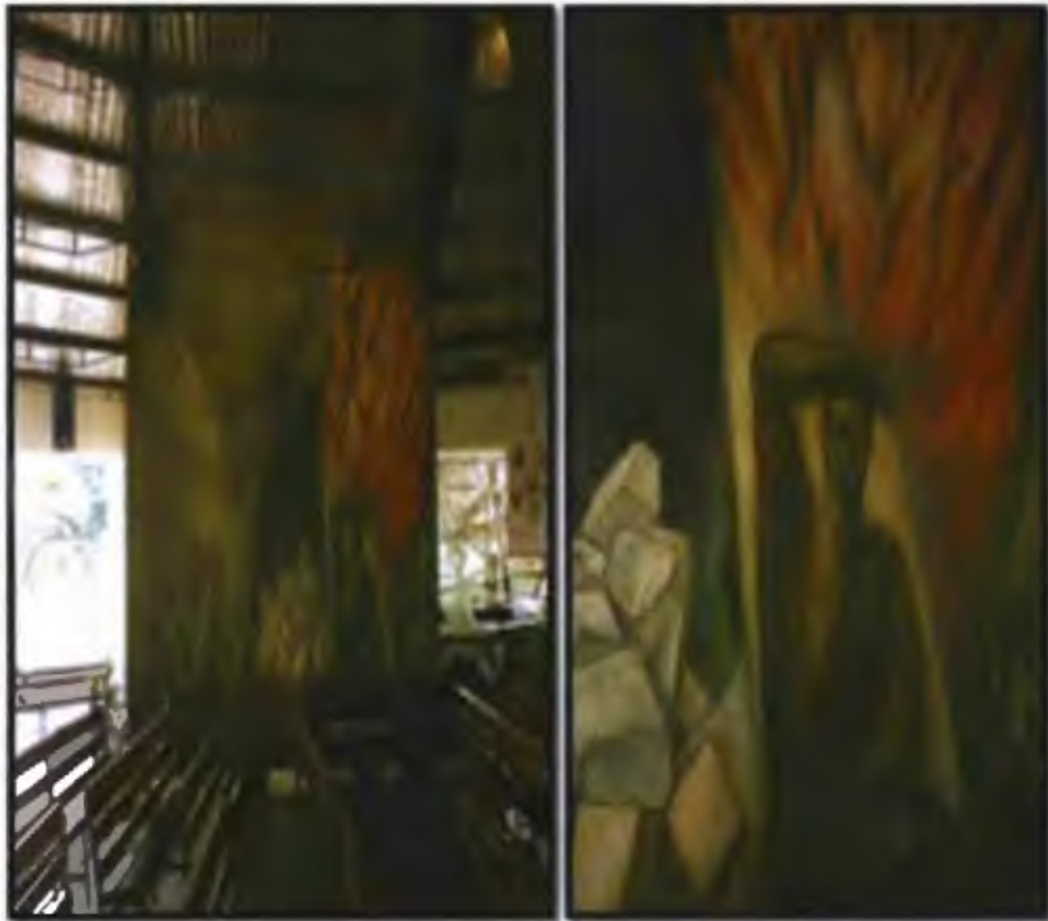
Pintura mural diseñada y confeccionada por la artista norteamericana Lilian Bruc. El mural se encuentra en el muro oeste del centro bajo el título de la Profecía