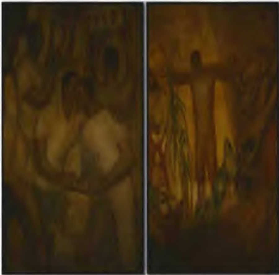
Detalle del mural de La Nueva Pascua, donde muestra valores como Comunitario, de un pueblo que camina en la fé de Cristo vivo a travé