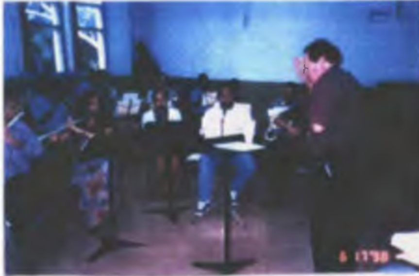
I SEMESTRE DIRECCION Y EJECUCION ORQUESTAL POR EL DR. Y MAGISTER CUEARPENTER DE CASTRO