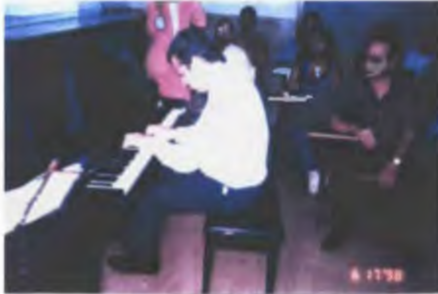
I SEMESTRE; DANZA DEL VIEJO BOYERO DE GINASTERA POR LLIS TROETSCH