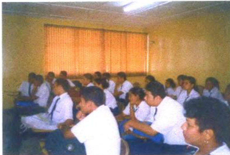
Ilustración y/o fotografía n°19

Observación de vídeos producidos por los estudiantes realizando entrevistas; función evaluativa del vídeo.