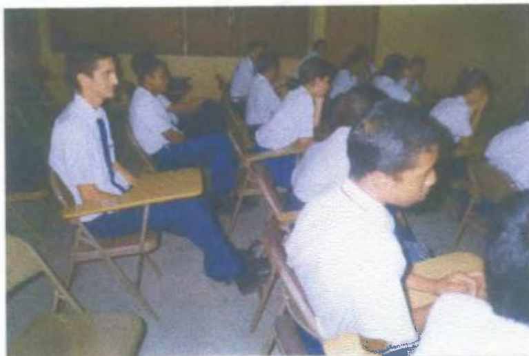
Ilustración y/o fotografía n°7

La función motivadora del vídeo logra comunicar, de manera inmediata y emotiva, los mensajes.