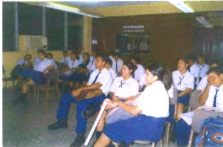
Ilustración y/o fotografía n°31

La función evaluativa del vídeo contribuye al desarrollo de la personalidad del estudiante.