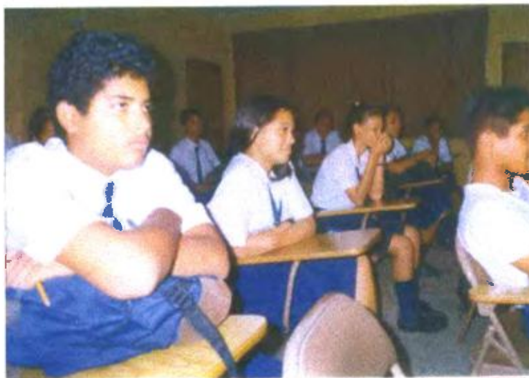
Ilustración y/o fotografía n°13

Los estudiantes se autoevalúan; el vídeo descubre al sujeto que se quiere descubrir como es, en una determinada situación. El vídeo ofrece la posibilidad de evaluar conductas, actitudes o destrezas.