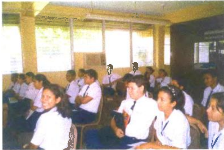
Ilustración y/o fotografía n°29

El vídeo es un espacio educativo para promover procesos de relaciones educativas.