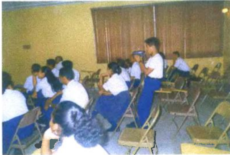
Ilustración y/o fotografía n°15

La incorporación del vídeo en el ámbito escolar es un factor de innovación en el proceso educativo.