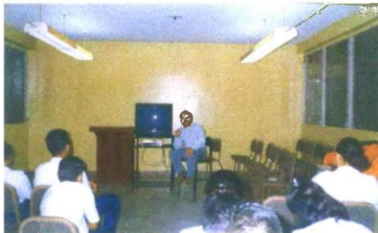
Ilustración y/o fotografía n°26

El uso más ventajoso del vídeo es la posibilidad de una retroalimentación inmediata.