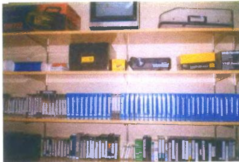
Ilustración y/o fotografía n°1

Incorporación del vídeo en el quehacer cotidiano del proceso de enseñanza-aprendizaje.