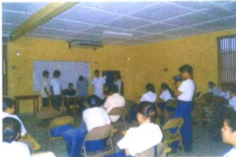
Ilustración y/o fotografía n°21

Los estudiantes participan en una obra de teatro, usan la cámara videgrabadora para extraer las grandes posibilidades educativas del lenguaje visual.