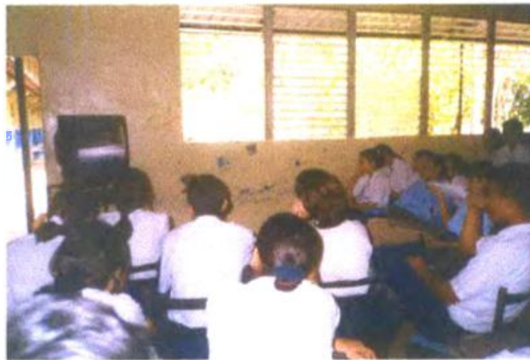
Ilustración y/o fotografía n°32

El uso del vídeo para el registro de imágenes acerca de fenómenos irrepetibles, tiene función investigadora.