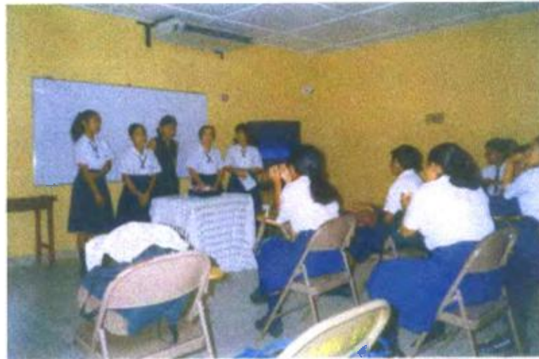
Ilustración y/o fotografía n°17

La eficacia pedagógica y didáctica del vídeo se evidencia cuando su uso es puesto en manos de los estudiantes para que se conozcan mediante la producción de sus vídeos expuestos en clase para su evaluación en la asignatura de Arte Comercial.