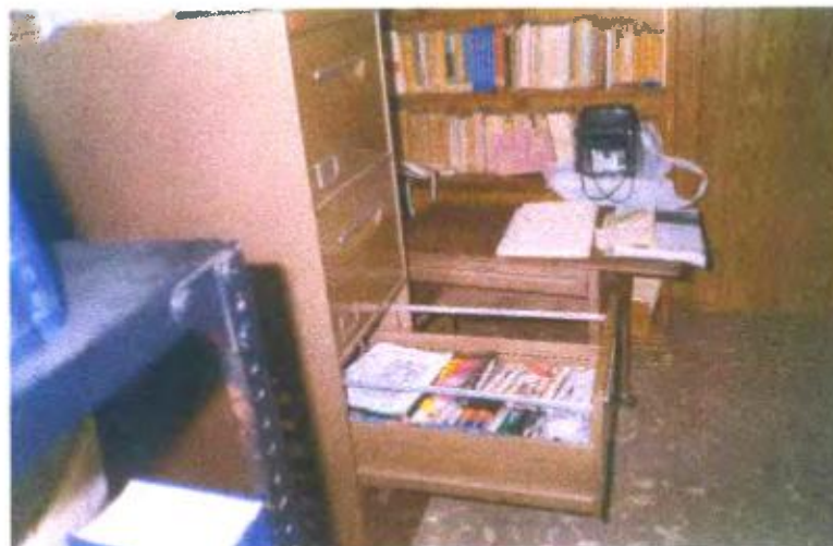
Ilustración y/o fotografía n°24

En la etapa de planeamiento, es importante identificar y analizar la posibilidad para la obtención de vídeos.