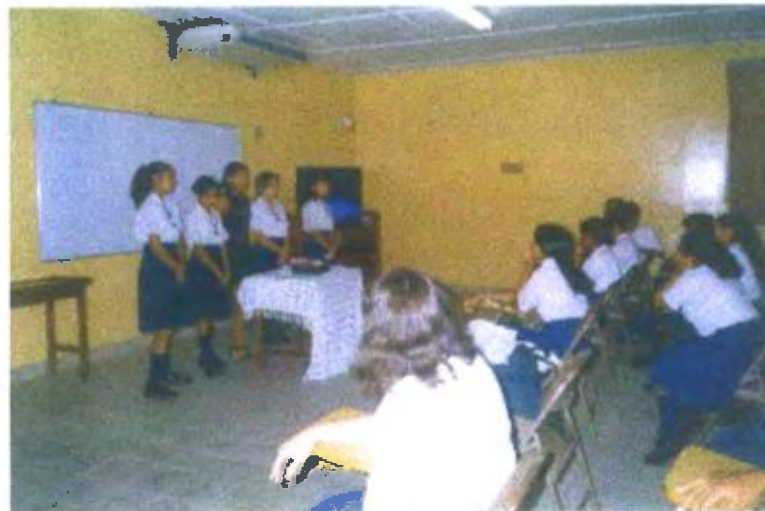
Ilustración y/o fotografía n°18

El vídeo producido por los estudiantes responde a contenidos curriculares específicos; tiene la función que corresponde a la categoría vídeo como medio didáctico.