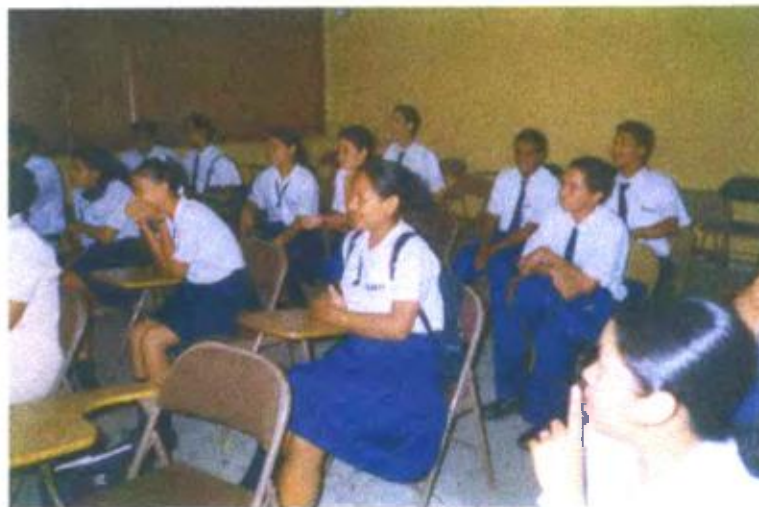
Ilustración y/o fotografía n°22

La incorporación de la imagen ha de suponer su valoración como objeto de reflexión.