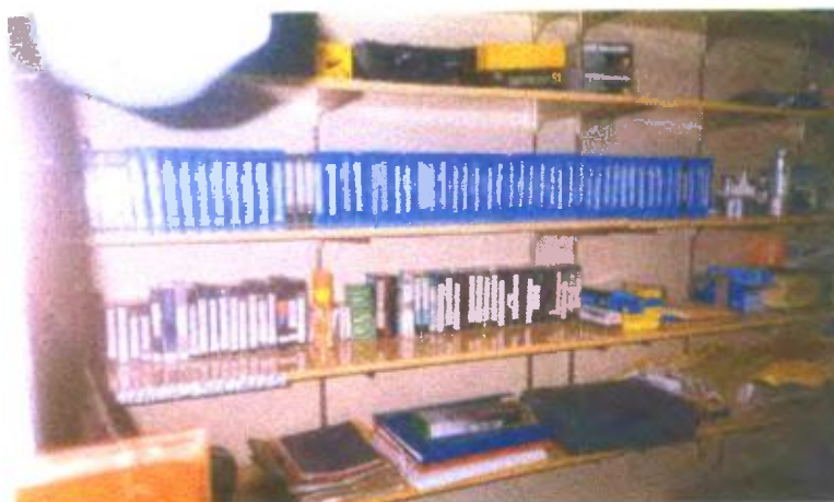
Ilustración y/o fotografía n°4

Equipamiento de vídeos en el depósito del aula de audiovisuales.