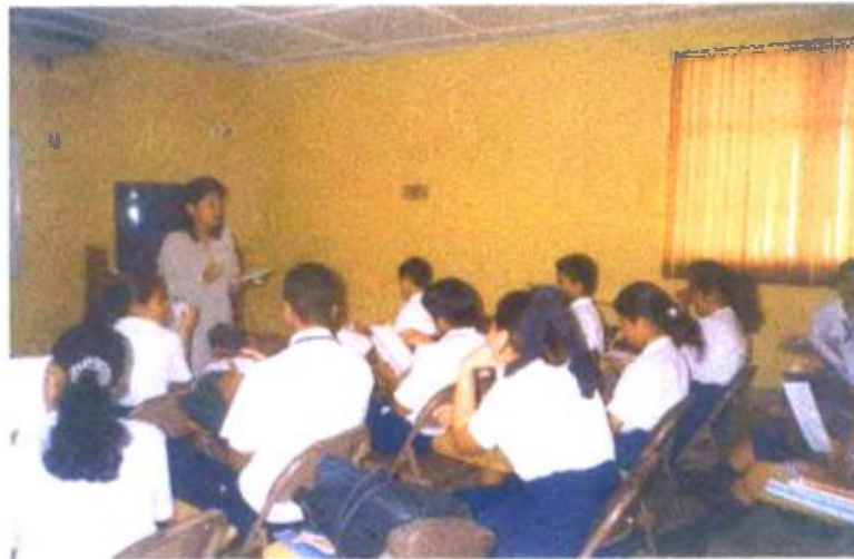
Ilustración y/o fotografía n°6

La profesora a través de las técnicas de análisis de contenido, facilitar la adquisición actualizada de información e incentiva el gusto por aprender y conocer.