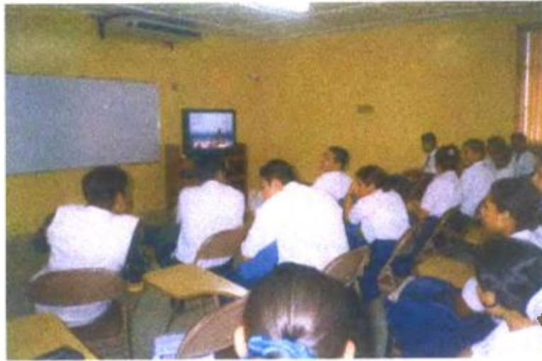
Ilustración y/o fotografía n°5

El vídeo es útil para el aprendizaje del estudiante porque éste logra comunicar sus vivencias, emociones y opiniones.