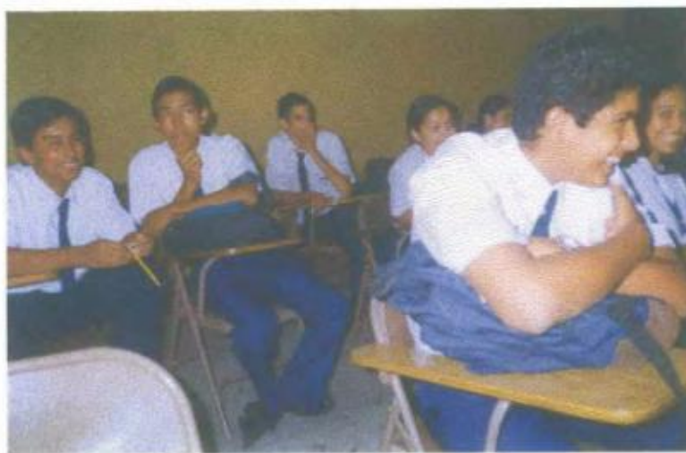
Ilustración y/o fotografía n°8

El uso del vídeo promueve la interacción estudiante-estudiante; hacen comentario de lo que observan sobre su propia imagen, sus actos en la participación en la obra de teatro.