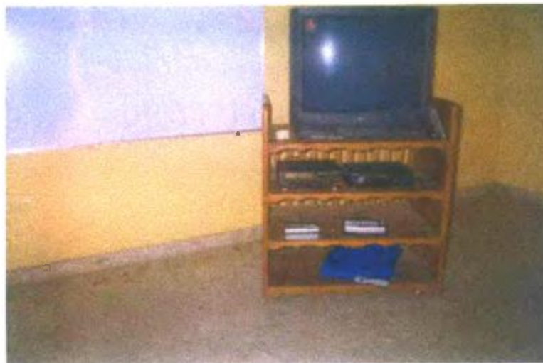
Ilustración y/o fotografía n°2

Aula de audiovisuales con el equipamiento mínimo que requiere la presentación de vídeos.