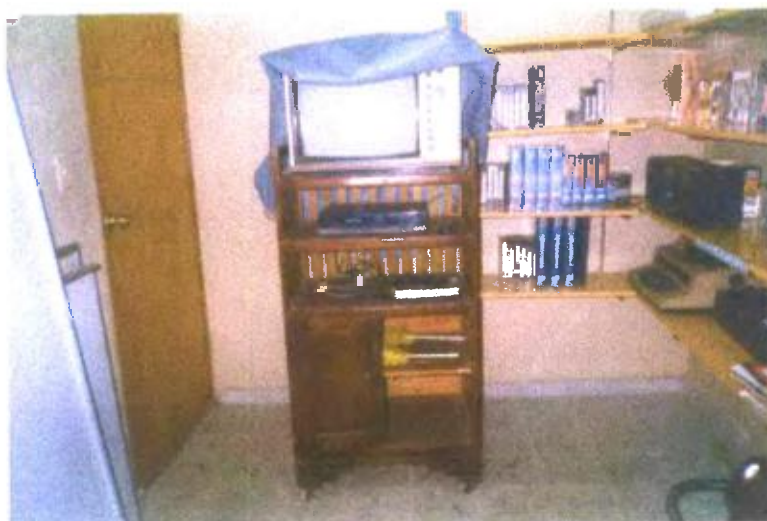
Ilustración y/o fotografía n°3

Dotación de equipo y espacio necesario para llevar a cabo el visionado de vídeo como recurso didáctico.