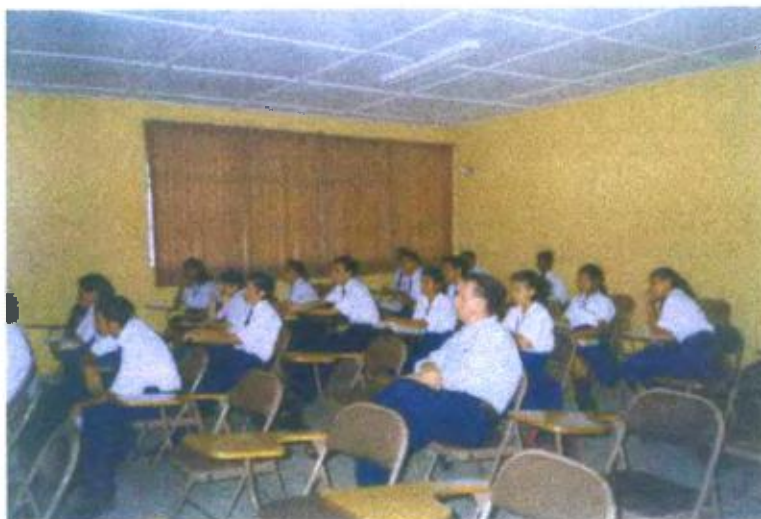
Ilustración y/o fotografía n°14

El vídeo es usado como apoyo en la actividad docente, para desarrollar los contenidos de Historia sobre la invasión de Estados Unidos a Panamá.