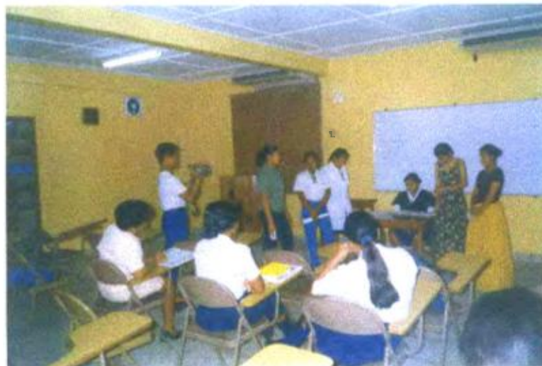
Ilustración y/o fotografía n°16

El vídeo proceso es elaborado por los docentes y estudiantes. Tiene la ventaja didáctica de estimular la participación, la creatividad, el compromiso e implicación en la actividad. La actividad del vídeo es puesta en manos de los estudiantes para que logren experiencias de aprendizaje.