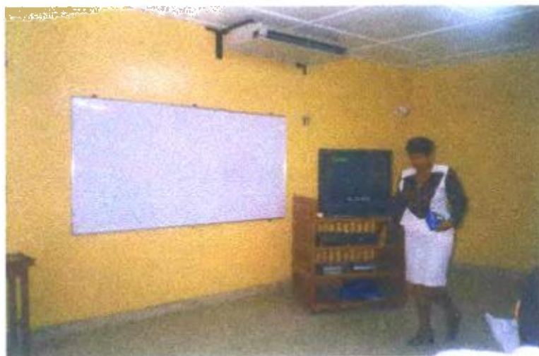
Ilustración y/o fotografía n°10

Actualización permanente de las formas en que la escuela realiza su función docente.