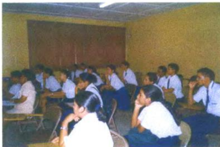
Ilustración y/o fotografía n°12

La función expresiva del vídeo es útil para el aprendizaje. La tecnología del vídeo es puesta en manos de los estudiantes para que logren, a través de ella, comunicar sus vivencias.