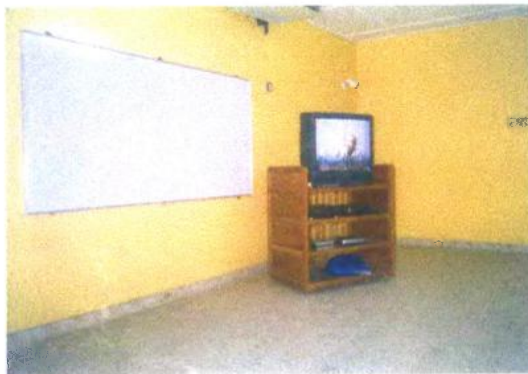
Ilustración y/o fotografía n°9

El vídeo y el televisor son recursos y medios didácticos a través de los cuales es posible acceder a las imágenes del mundo.