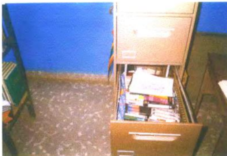
Ilustración y/o fotografía n°25

La tendencia es la incorporación del vídeo en el ámbito escolar.