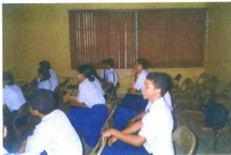
Ilustración y/o fotografía n°11

La imagen como forma de lenguaje tiene una dimensión emotiva.