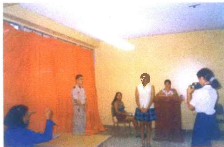
Ilustración y/o fotografía n°28

El vídeo, la dotación de equipo para su producción tanto por el cuerpo docente como por los educandos.