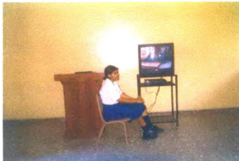
Ilustración y/o fotografía n°30

El vídeo es puesto en manos de los estudiantes para que logren experiencias de aprendizaje y se autoevalúen.