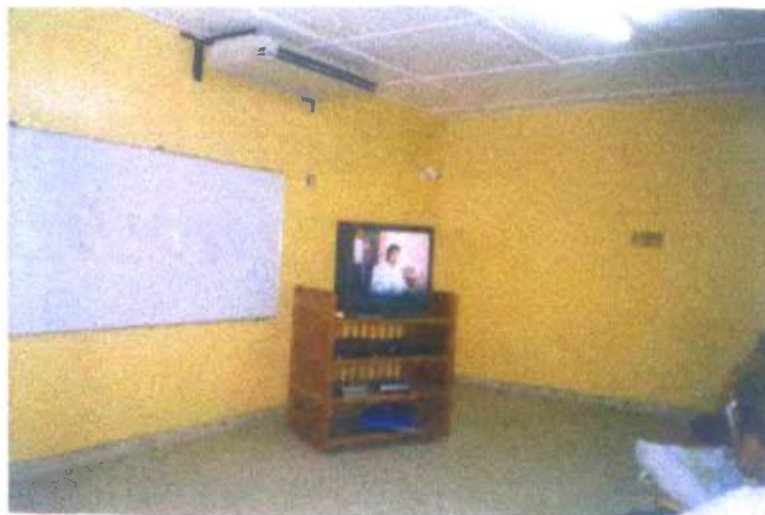
Ilustración y/o fotografía n°20

Vídeo de entrevista realizada a las autoridades del Distrito, registrando información para su posterior discusión en clase. El vídeo tiene función investigadora.