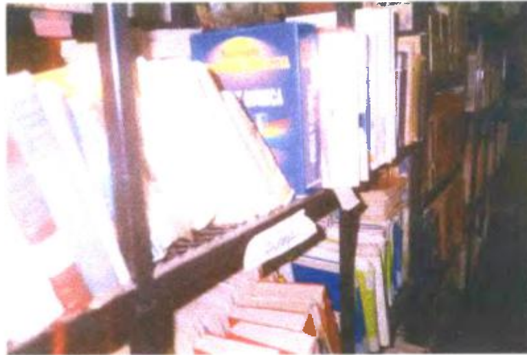
Ilustración y/o fotografía n°27

En la escuela, hay una persona responsable de las enciclopedias audiovisuales. La bibliotecaria tiene la función de previsión de equipos.