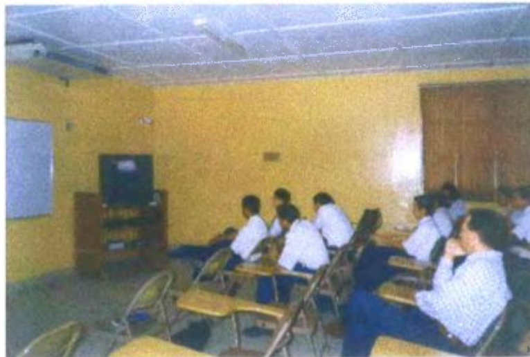
Ilustración y/o fotografía n°23

El vídeo mediatiza el proceso de adquisición de conocimientos que se relacionan con los que se tienen para construir y proyectar otros.