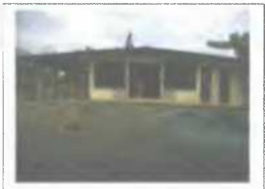
Foto N°3: Restaurante de las mujeres del asentamiento Carrizaleños Unidos