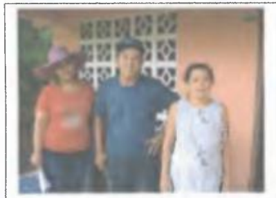
Foto N°9: Socios del Asentamiento Campesino "El Bongo" de Montijo