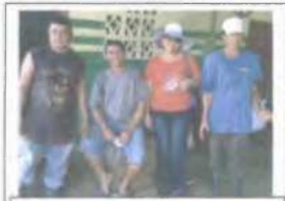
Foto N°5: Socios del asentamiento Carrizaleños Unidos, en la planta de pilado de arroz.