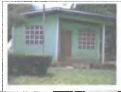
Foto N°8: Viviendas construidas en los asentamientos campesinos de Veraguas durante la década de 1970.