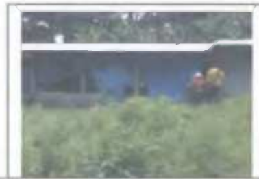
Foto N°6: Pollerizas y matadero de pollos en el asentamiento Carrizaleños Unidos.