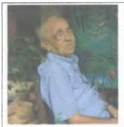
Foto 13: Entrevista al dirigente comunista Carlos Francisco Changmarín.