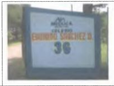
Foto N°7: Entrada al Colegio Secundario que lleva el nombre del dirigente comunista, en Carrizal de Soná