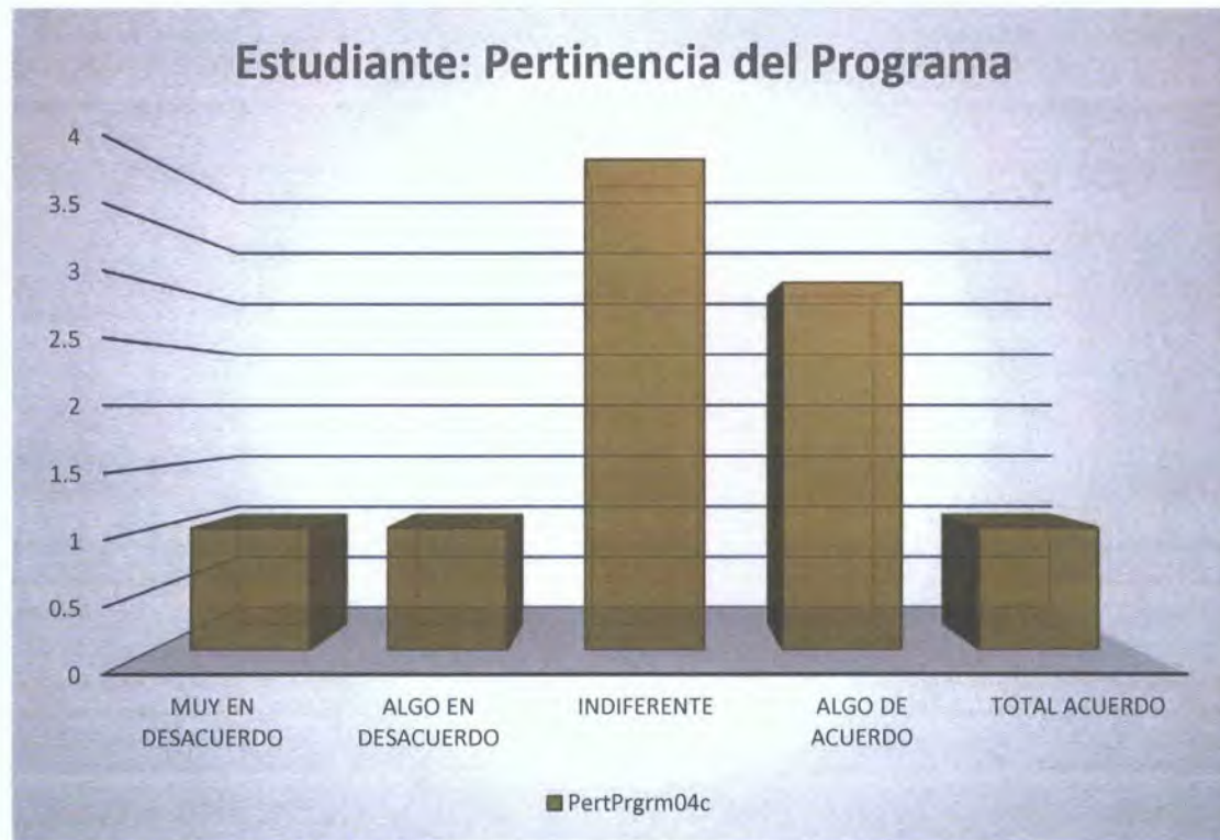
Gráfica 5. Percepción de los estudiantes en cuanto a la pertinencia del programa magistral específico.