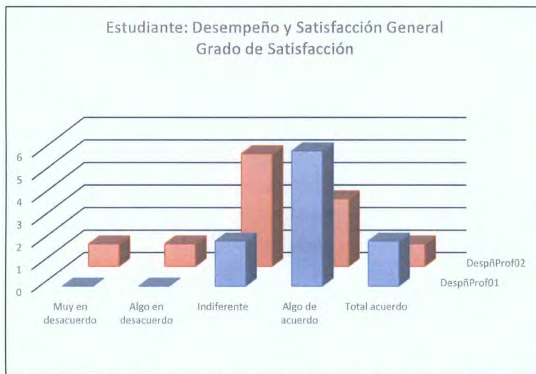
Gráfica 2. Grado de satisfacción de los estudiantes, en la categoría Desempeño y Satisfacción General.