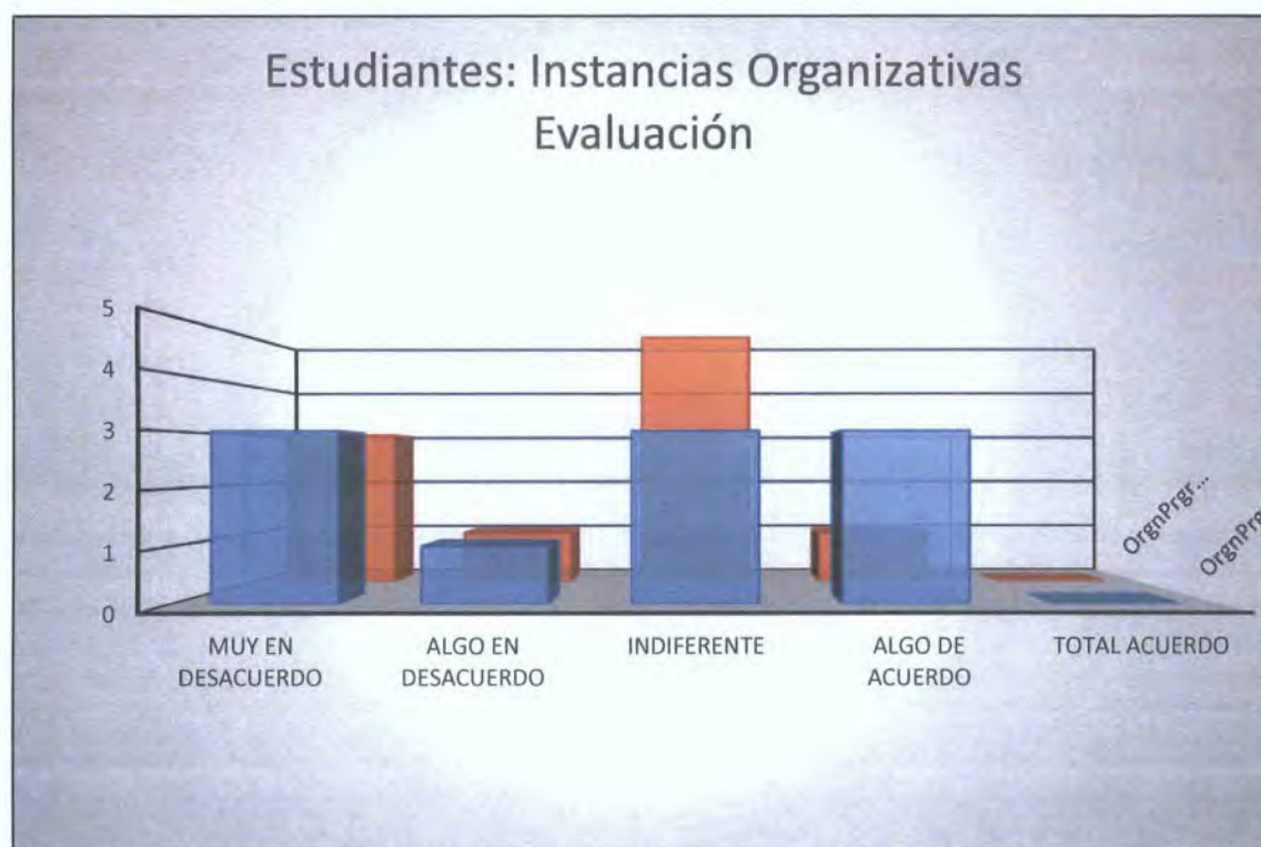
Gráfica 3. Percepción de los estudiantes en cuanto a la forma como se desarrolla la evaluación, en la categoría Instancias Organizativas.