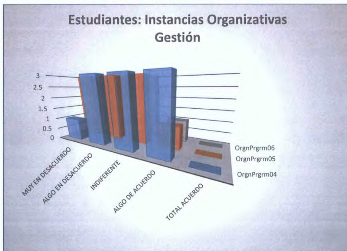
Gráfica 4. Percepción de los estudiantes en cuanto a la forma como se desarrolla la gestión administrativa, en la categoría Instancias Organizativas