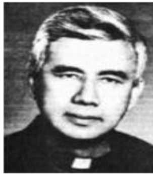
Foto del padre Rutilio Grande

Fuente: (Australia, s.f.)