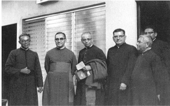
Foto en conmemoración a sus Bodas de Plata de sacerdocio