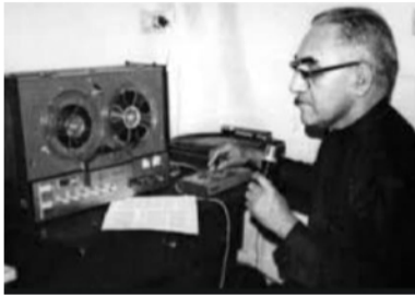
Foto tomada en transición desde la Radio Venceremos