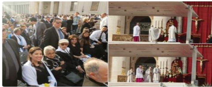
Foto de familiares de Santo Óscar Arnulfo Romero en la ceremonia de su beatificación.

Fuente: Copywrite 2018 por IMoreno. (Guzman, 2018)