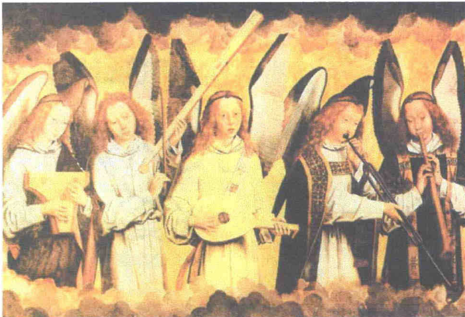
Cuadro de Hans Memling, Angeles Músicos , panel lateral del Tríptico de Nájera h.1480. Koninklijk Museum voor Schone Kunsten, Amberes

Los grabados de Fray Angélico del siglo XIV y las pinturas de Hans Memling (1430-94) del siglo XV en los Países Bajos, llevan el mismo nombre “Angeles Músicos,” tomando en cuenta los 100 años de diferencia entre ambos trabajos.