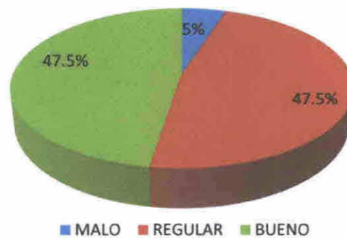
FIGURRA No. 8 GRAFICA DE VARIABLE No. 2 EXPORTACION