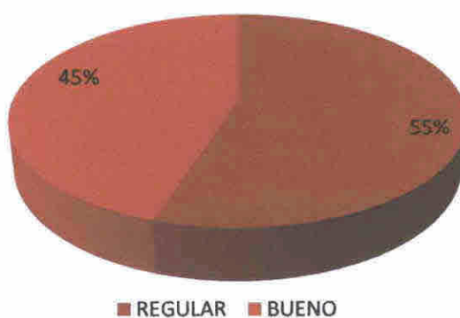
FIGURA No. 14 GRAFICA DE VARIABLE No. 8 INVERSION