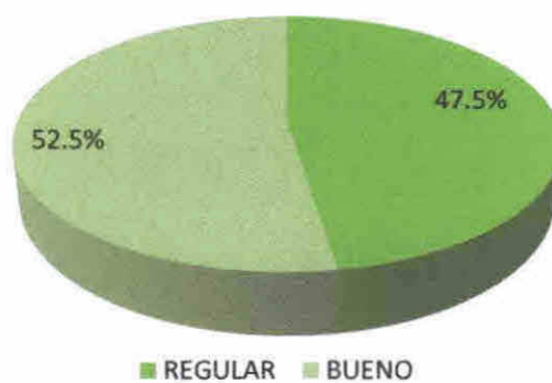
FIGURA No. 12 GRAFICA DE VARIABLE No. 6 CAPACITACION