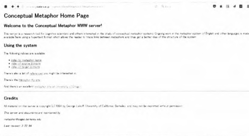
Figura 1: Entorno de trabajo de la página Conceptual Metaphor Home Page

El entorno de la página de inicio aparece en la siguiente figura: