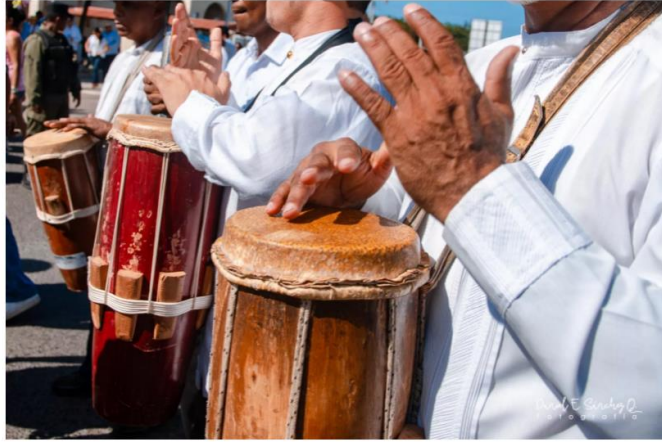
Tambor de cuña

El tambor representa una inmensa figura de la cultura panameña, que estuvo presente en nuestro más remoto origen y que además es la cima de la consagración vital que merece honda simpatía y auténtico respeto.