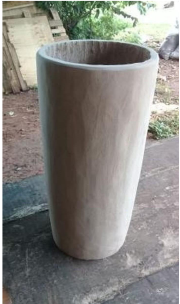
Escarbado del palo (final)