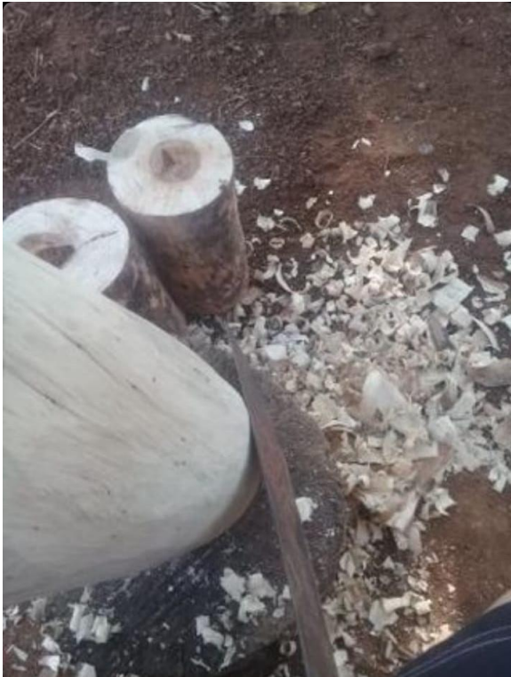
Selección de material (madera de Cedro espino)