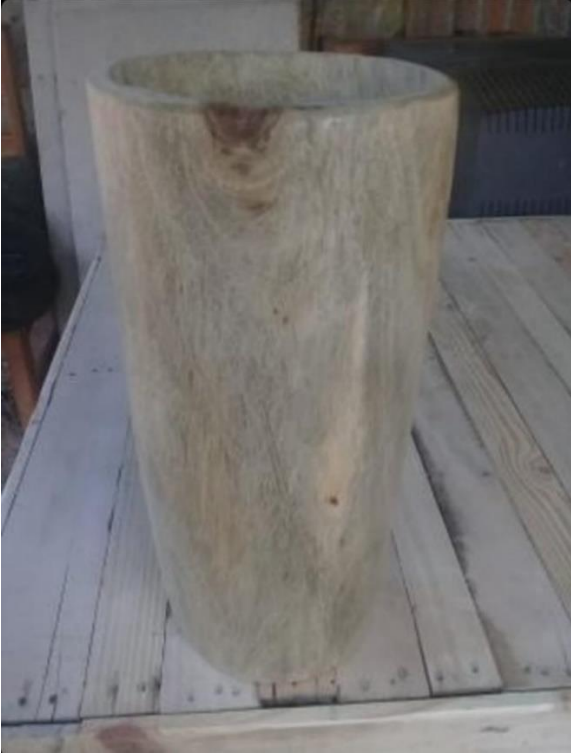
Completo sin barniz