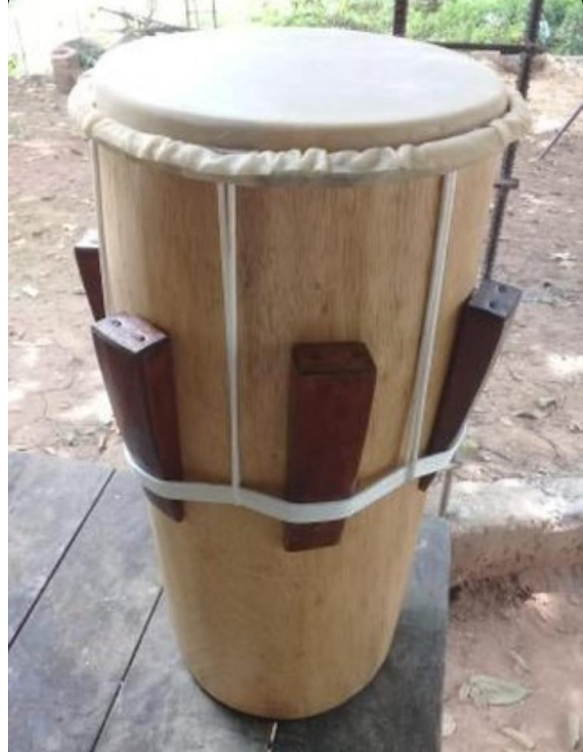
Completado con barniz