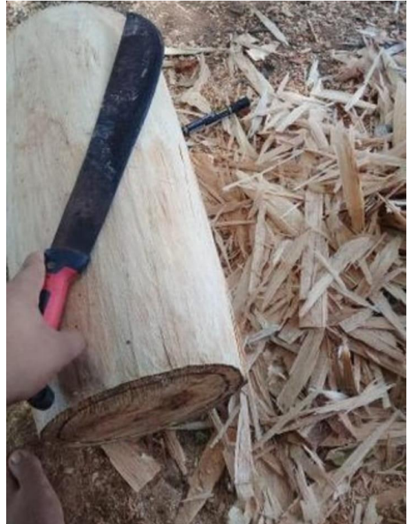
Limpieza de la madera