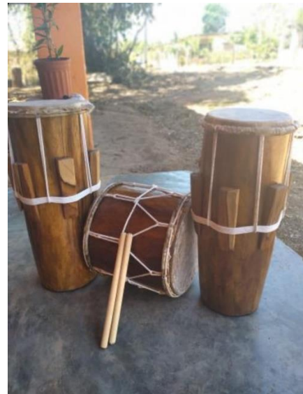
Los tambores de cuña y la caja son herencia africana