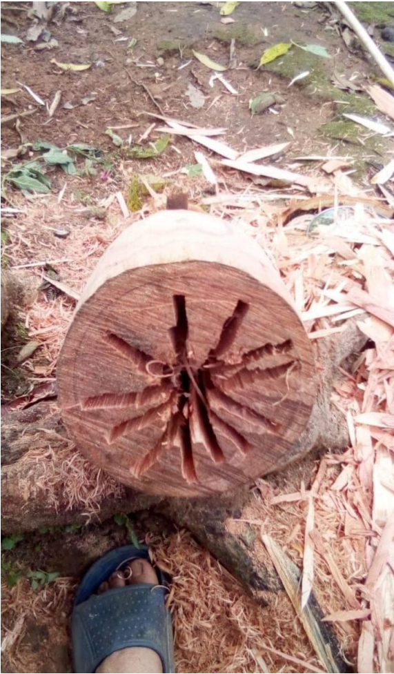
Escarbado del palo (inicio)