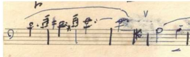
Figura 53 - fonte A, Valsa improvisada,

Se puede ver que el editor adiciono algunas dinámicas diferentes al manuscrito original con anotaciones de Mignone o posiblemente de Devos. (MEDEIROS, 2015)