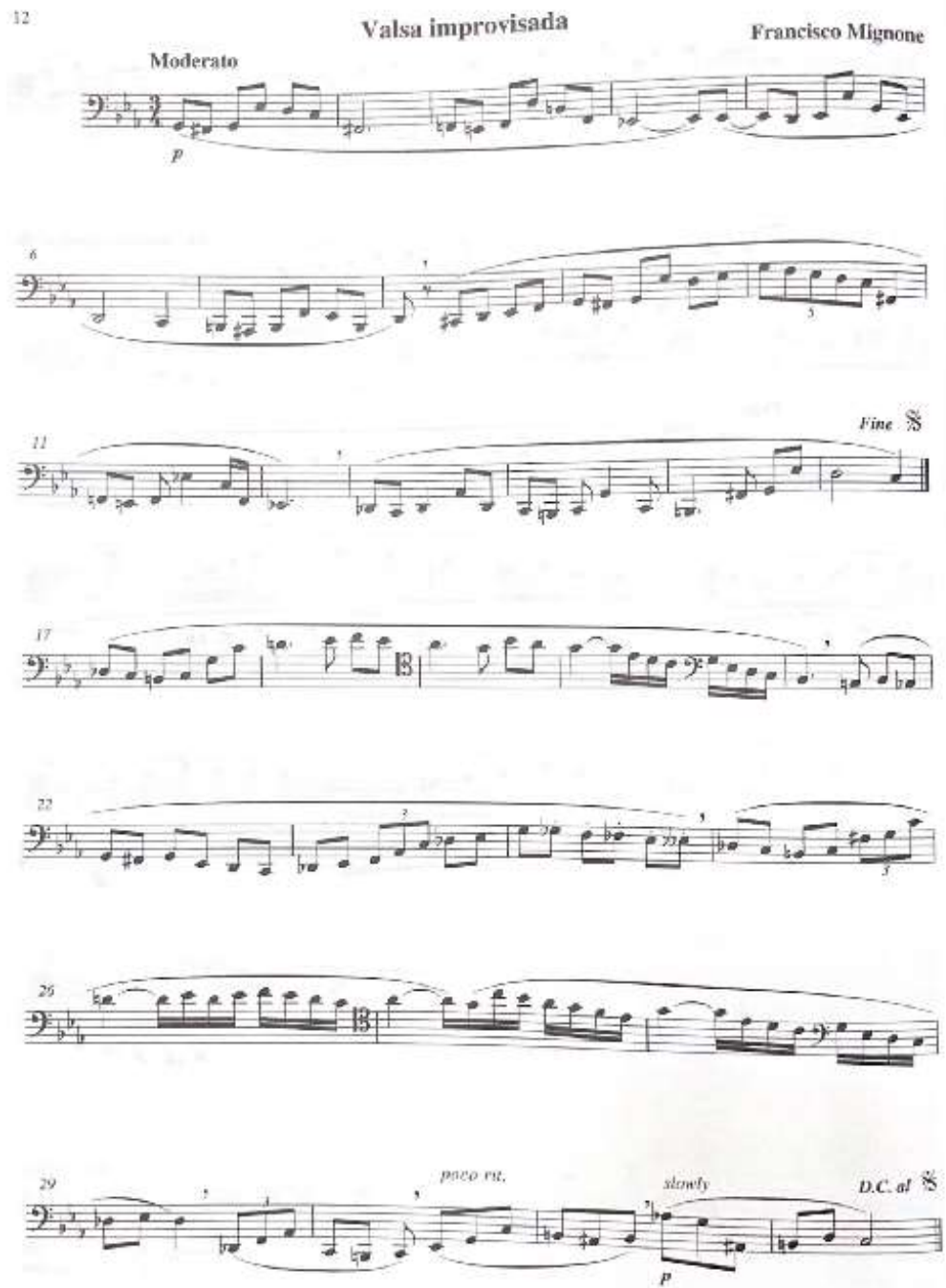
Ilustración 6: Valsa Improvisada del conjunto de 16 Valsas para Fagot Solo de Francisco Mignone última versión revisada por Benjamín Coelho.