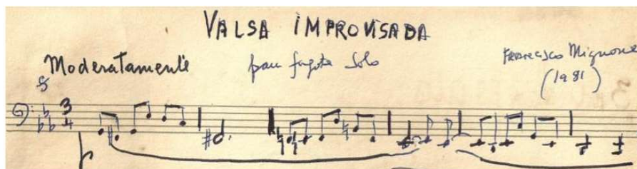
Figura 50 - fonte A com indicação de dinâmica no compasso 1

Existen algunas diferencias y un error: la repetición de un compás. Otro aspecto a considerar es la adición y el cambio de dinámicas, lo que lleva a pensar que tal vez fueron añadidas por la intervención de Devos, o por la guía del compositor después de escuchar las grabaciones.