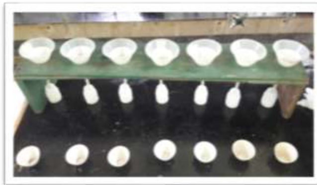
Filtrado de la solución