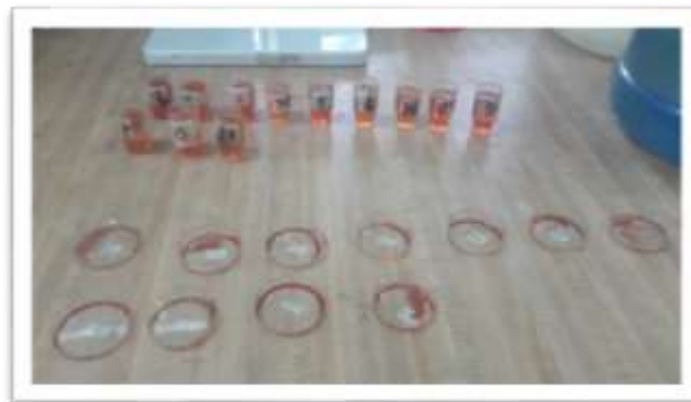
Determinación de boro por colorimetría