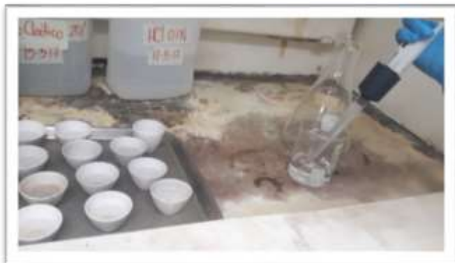
Muestras foliares y HCl