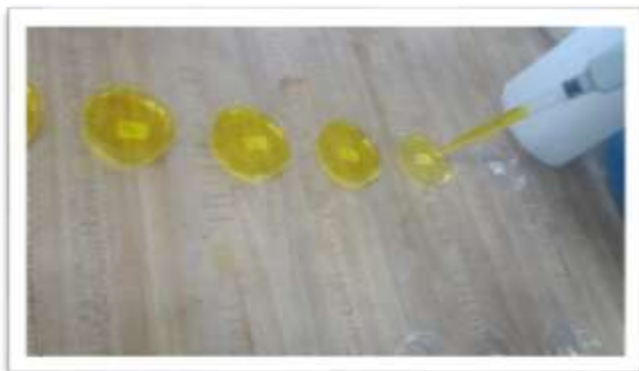
Solución más curcumina