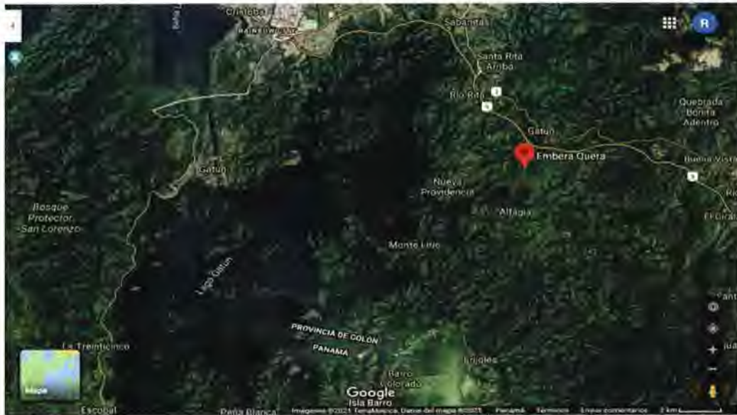
Figura 1 Localidad del Sitio de Estudio

La Comunidad Emberá Quera se ubica en un bosque húmedo tropical poco intervenido, con una época seca que va de enero a abril y una época lluviosa de mayo a noviembre, una precipitación de aproximadamente 2500 mm, temperatura promedio de 26°C y una humedad relativa de 92%. (Etesa 2020).