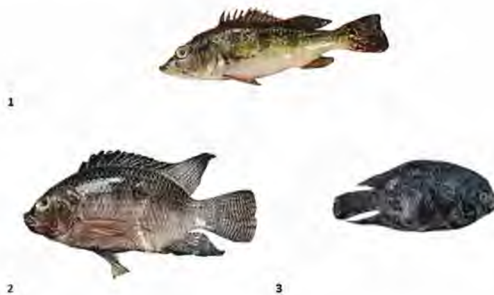
Figura 5 Peces secundarios en Lago Gatún. 1 Cichla ocellaris 2. Oreochromis niloticus 3. Vieja maculicauda 12-9- 2022