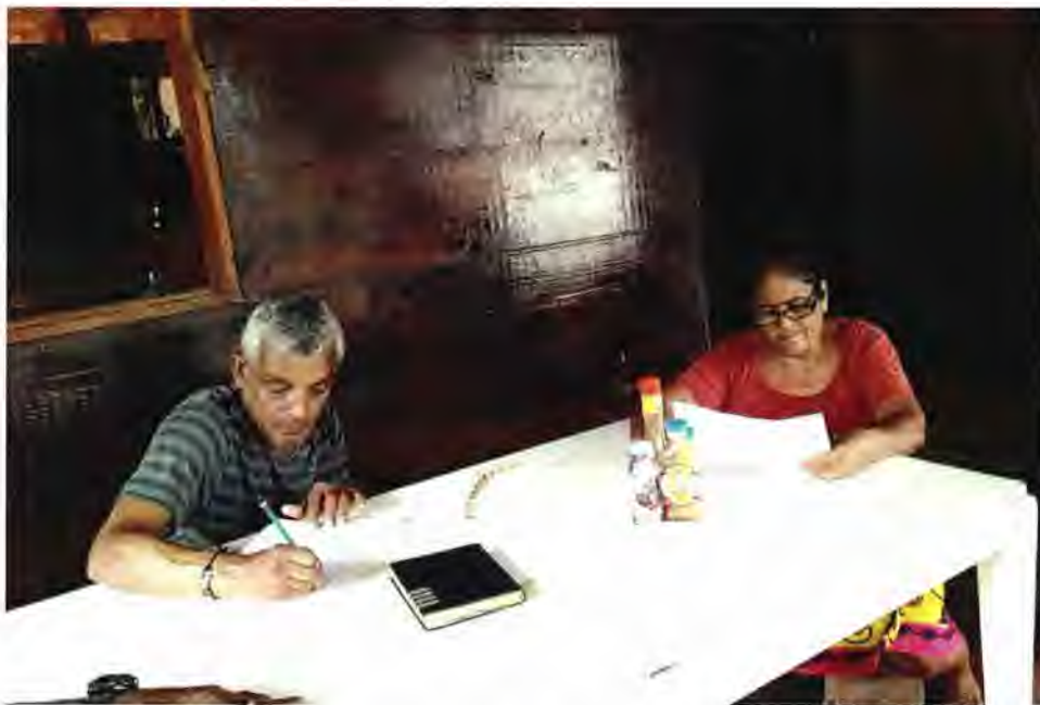
Figura 3. Entrevista a informante clave de la Comunidad Emberá Querá

Para validar el conocimiento que tiene la comunidad Emberá Quera sobre la diversidad Ictiofaunístico se aplicó una entrevista semiestructurada, a partir de un instrumento que fue validado por cuatro expertos y cuatro autoridades de la comunidad (Vela Peón (2001)). (Figura 3).