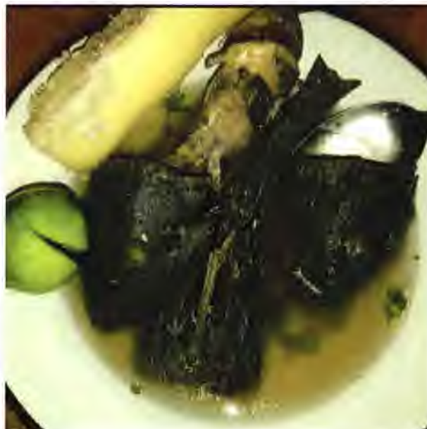
Figura 9. Plato tradicional Sopa de Wuacuco

Para los Emberá Querá, la chupa piedra es un pez fácil de atrapar, estos peces habitan a pocas profundidades del río, adheridos a las piedras; situación por la cual, lo pescan con herramientas fáciles de construir, como, por ejemplo, los palos afilados en la punta que funcionan como lanza o Chusos de hierro que utilizan con las lingas.