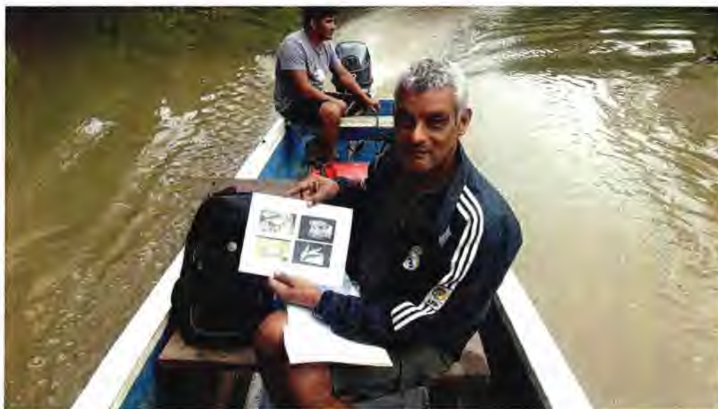
Figura 2. Recorrido para identificación de peces y tipo de pesca.

Para la identificación del grupo taxonómico, los peces eran fotografiados, además se contrastaban sus caracteres taxonómicos con una guía para peces elaborada por el Instituto de Desarrollo e Investigación Acuícola de Panamá (IDIAP) (Figura 2).