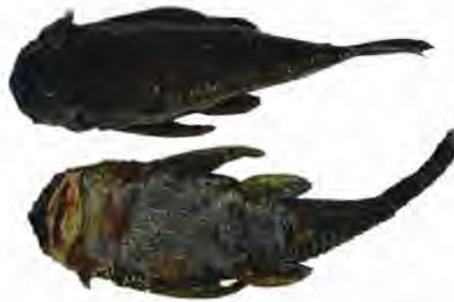
Figura 8. Vista dorsal y ventral de pez Chupa piedra ( Chaetostoma fischeri ) marzo de 202

Para los Emberá Querá, la chupa piedra es un pez fácil de atrapar, estos peces habitan a pocas profundidades del río, adheridos a las piedras; situación por la cual, lo pescan con herramientas fáciles de construir, como, por ejemplo, los palos afilados en la punta que funcionan como lanza o Chusos de hierro que utilizan con las lingas.