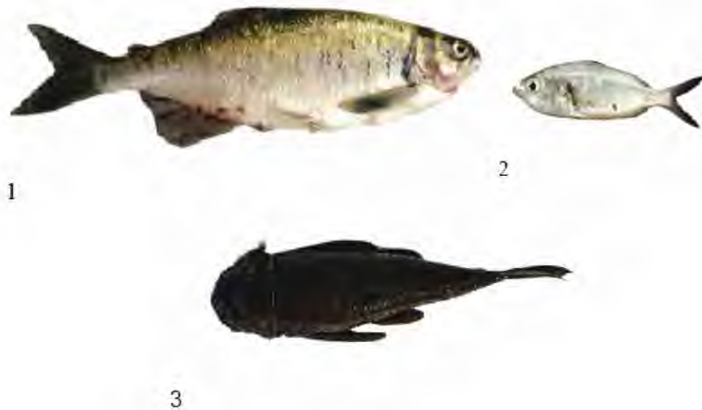
Figura 4 Peces Primarios en Lago Gatún. 1. Brycon chagrensis 2. Astyanax aeneus 3. Chaetostoma fischeri

Del total de especies listadas (Tabla 2), tres especies son según la propuesta de Miller (1976) dulceacuícolas primarias (Figura 4), es decir, son dulceacuícolas estrictas; en tanto que tres especies son dulceacuícolas secundarias, con tolerancia a condiciones variables de salinidad y 5 especies son periféricas, típicamente marinas o asociadas a ambientes costero-estuarinos con capacidad de incursionar en ambientes dulceacuícolas.