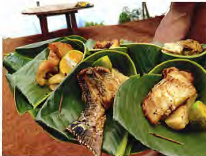
Figura 10 Plato Tradicional Sargento Frito con yuca en hoja de bijao

El Sargento es otro de los peces con alto valor de uso, es una alternativa cuando no hay Tilapias para ofrecer a los turistas; porque es más fácil de pescar. La carne es blanca, con pocas espinas, sin embargo, tiene un sabor diferente a la Tilapia. Lo ofrecen (Figura 8) en una variedad de platos como: sargento arropao en brazas con plátano sancochado y sargento frito con yuca o patacones.