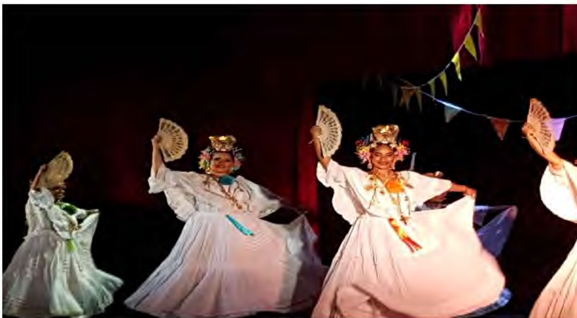
Figura 12. Gala de Ballet y Foklore, Facultad de Bellas Artes Universidad de Panamá, Domo Universitario