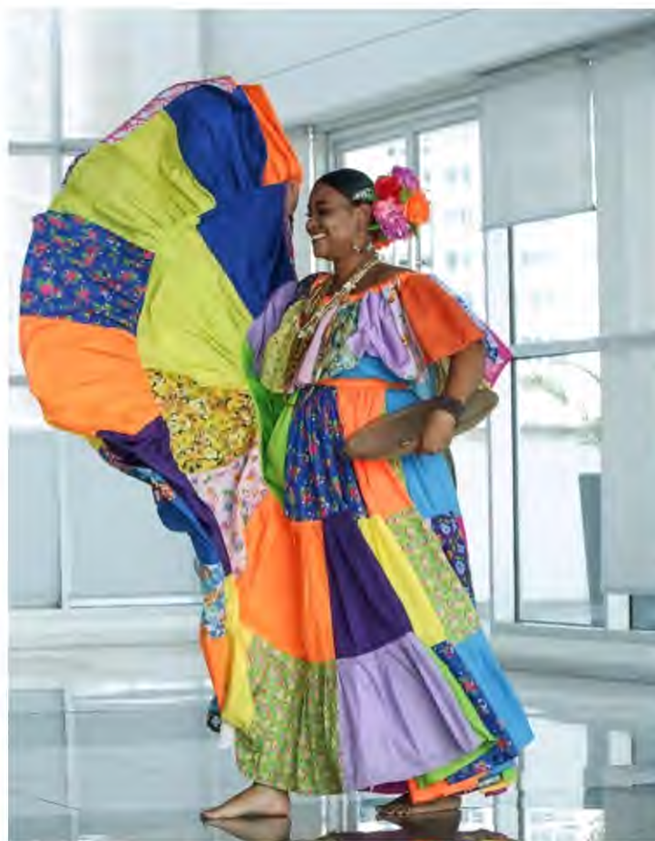
Figura 15. Mes de la Etnia Negra, Presentación Ministerio de Cultura