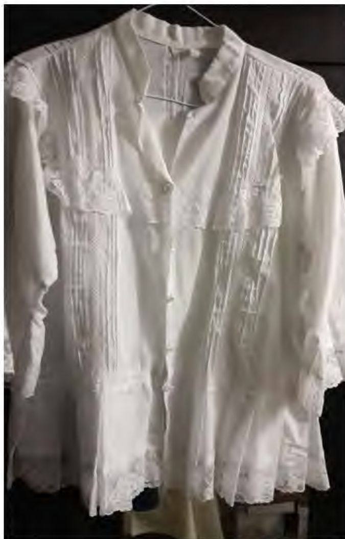
Figura 20. Aporte de una madre panameña