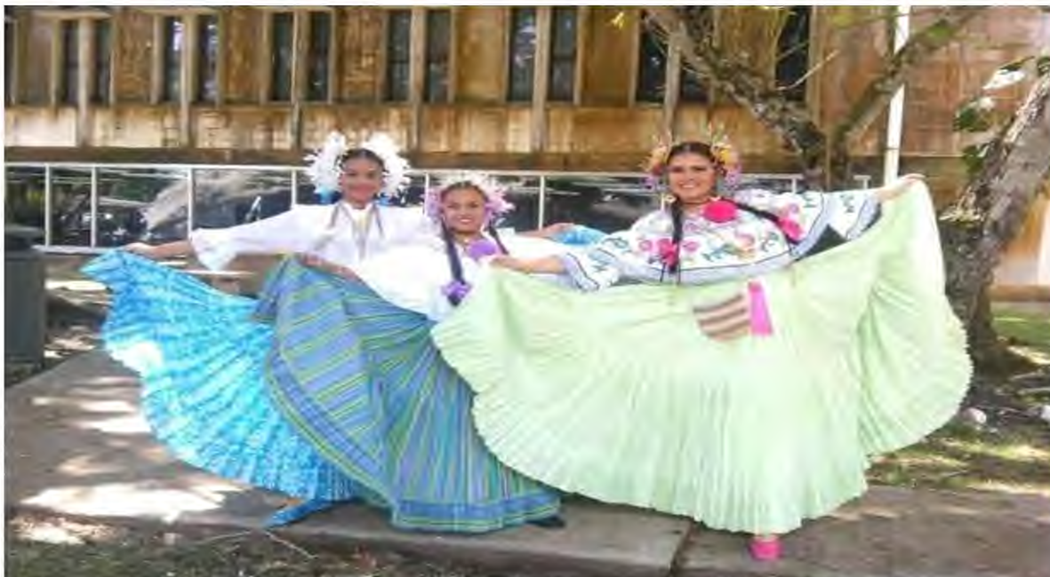
Figura 14. Propedéutico 2016, Facultad de Bellas Artes