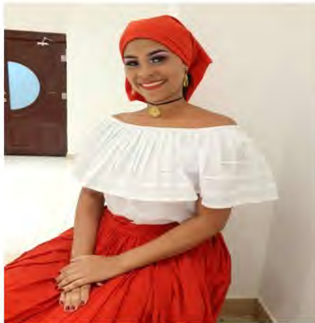
Figura 11. Participación Hotel Marriot, Técnica de Folklore