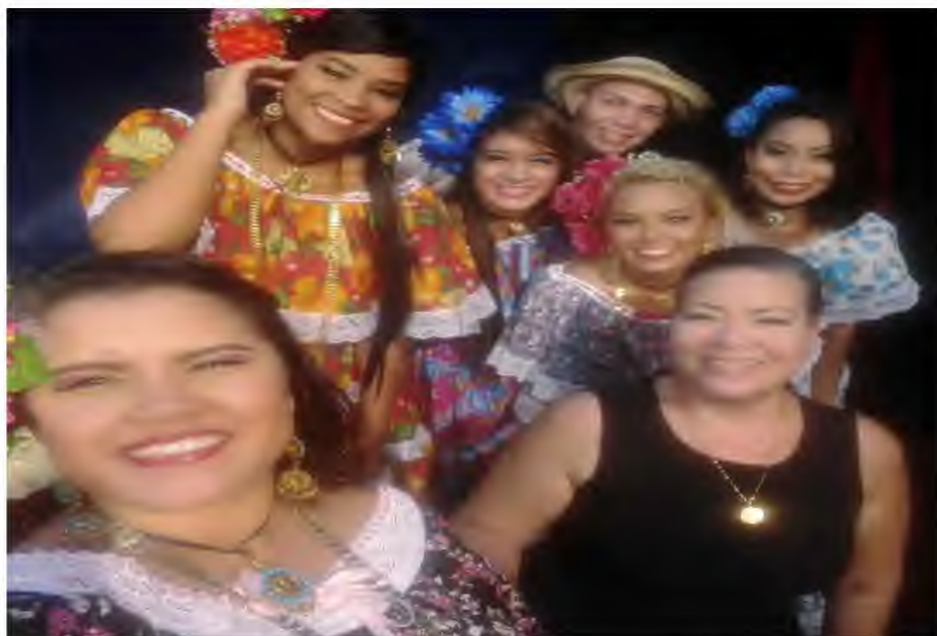
Figura 13. Actividad Salón F-112, Facultad de Bellas Artes