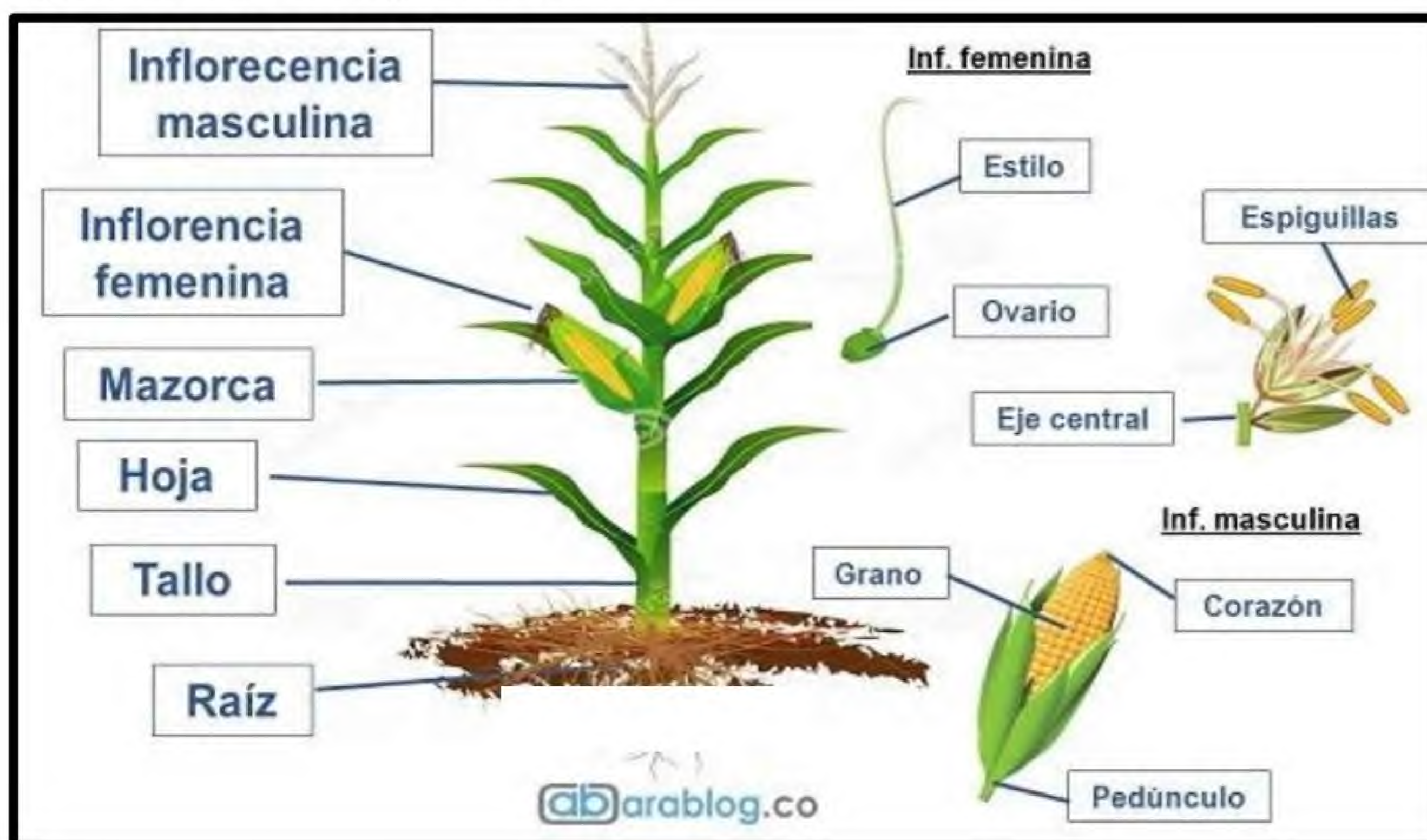
Figura 1. Partes de la planta de maíz.