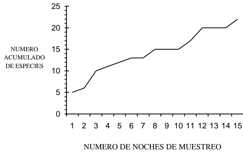
Fig. 2. Número acumulativo de especies capturadas