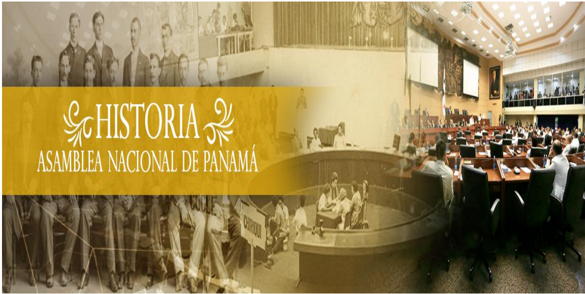
Junta Revolucionaria de 1903