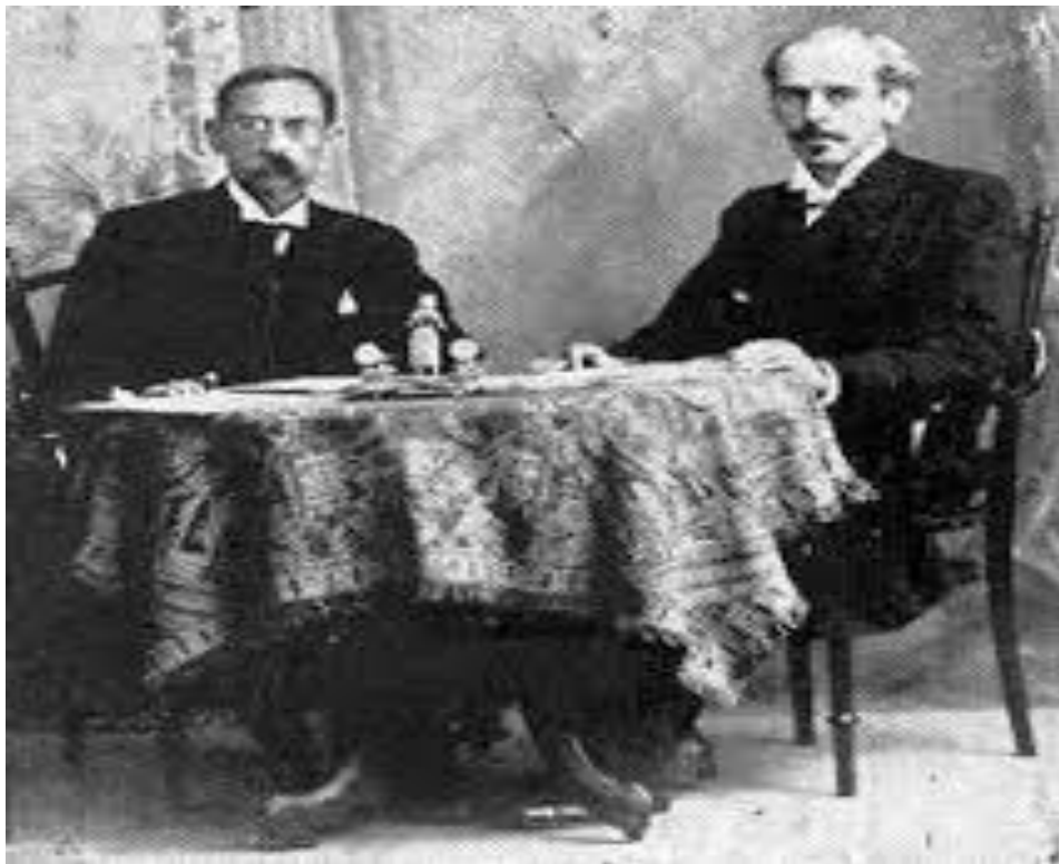
En esta imagen observamos al Dr. Pablo Arosemena (Liberal) Y al Dr. Luis de Roux (conservador)