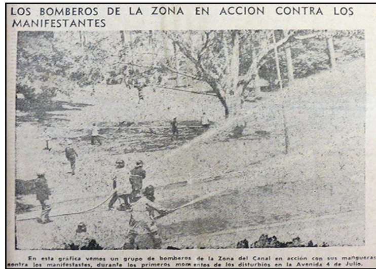
Ilustración 5. Bomberos de la zona en acción contra los manifestantes