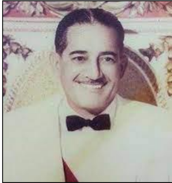
Ilustración 9. Presidente Ernesto de la Guardia

Nota: Imagen del presidente Guardia el cual manifestó a los estudiantes, a través de los medios de comunicación, que iniciaría negociaciones para que la Bandera panameña sea izada en la Zona del Canal.