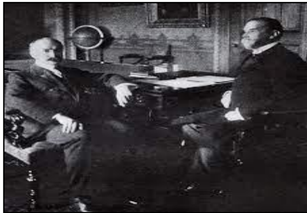
Ilustración 1. Tratado Hay Bunau Varilla

El Tratado Hay-Bunau Varilla, firmado el 18 de noviembre de 1903 entre Estados Unidos y la recién independizada República de Panamá, sentó las bases para la construcción y control estadounidense del Canal de Panamá. Este tratado, negociado entre el secretario de Estado de los Estados Unidos, John Hay, y el diplomático francés Philippe Bunau-Varilla, quien representaba a Panamá, otorgó a los Estados Unidos derechos exclusivos sobre la Zona del Canal de Panamá.