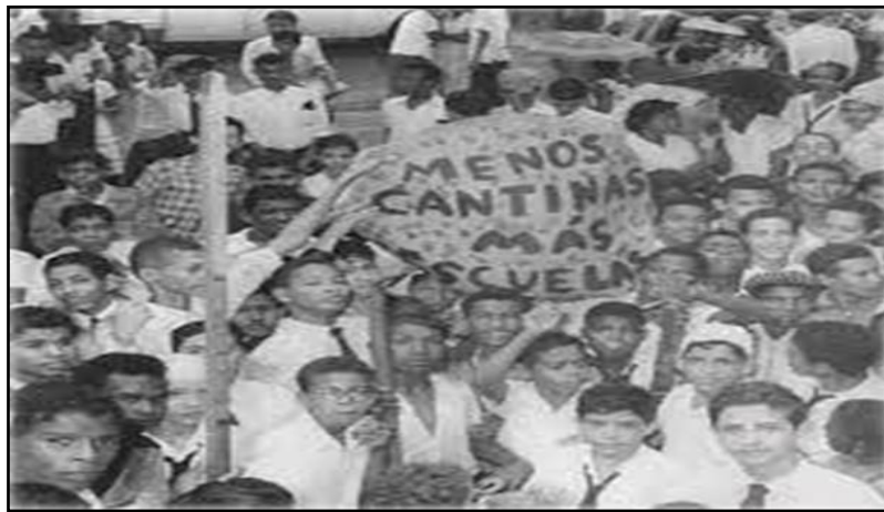
Ilustración 10. Estudiantes panameños exigiendo más colegios

La imagen nos presenta el descontento de la población estudiantil panameña, en donde exigían al presidente Guardia mejoras al sistema educativo.