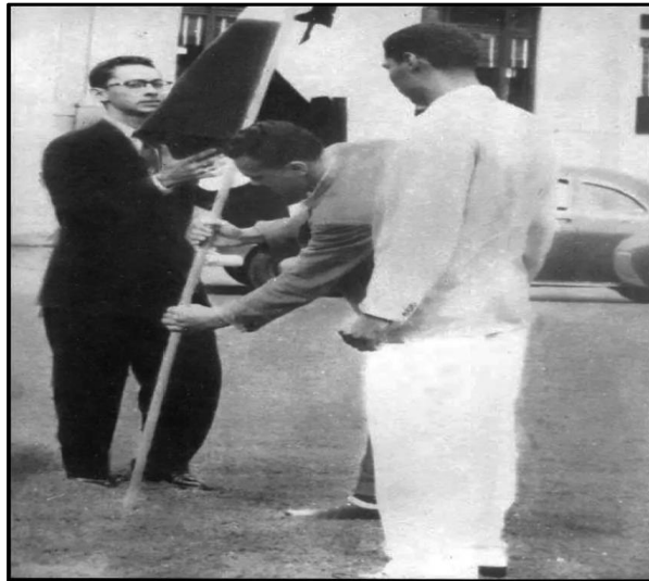
Ilustración 14. Operación Soberanía 2 de mayo 1958

Periódico la Hora 02/05/1958. "Todos los participantes, hombres y mujeres, usaban sacos para no dejar la impresión de que se trataba de vagos".