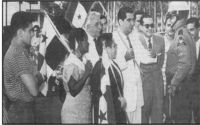
Ilustración 8. Eisenhower contra el plan internacionalización del canal

Fuente: Periódico Estrella de Panamá 02/05/1958