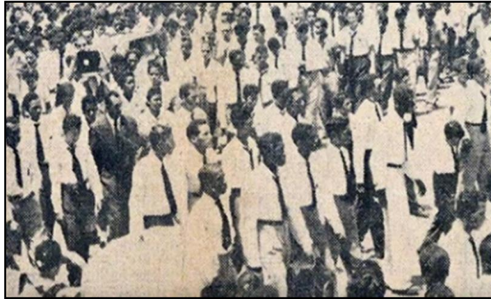
Ilustración 6. Marcha del 19 de mayo 1958

Fuente: Grupo de estudiante encaminados a protestar por los desmanes ocurridos en suelo nacional gesta estudiantil de mayo de 1958 / Cortesía: @PaViejaEscuela