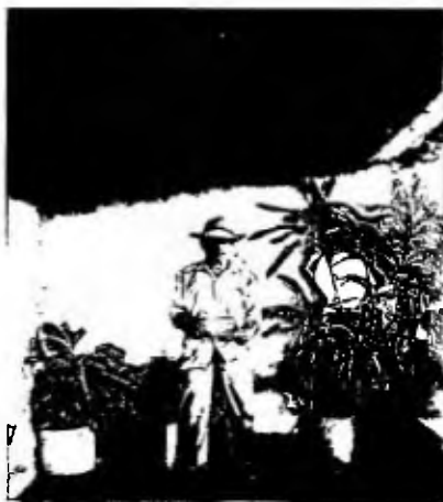
Vivienda más antigua de la graciana