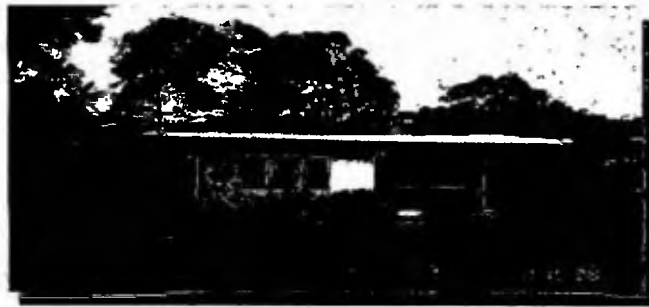
Vivienda moderna de la comunidad La Graciana

Su construcción duró tres meses; la vivienda posee una sala, dos recámaras y una cocina, con su respectivo portal. Según versiones del Sr. Jerónimo, los bloques (más de 2,000), fueron comprados en una de las primeras fábricas de bloques en Santiago, de propiedad del desaparecido Minguito De León. Estos bloques fueron trasladados en comandos, ya que la comunidad no contaba con buenas vías de acceso.