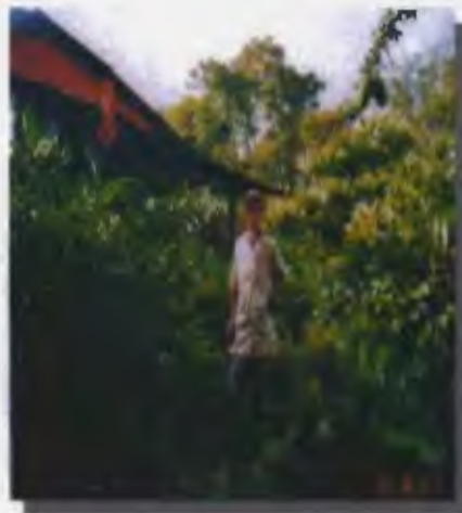
El habitante más longevo de la comunidad La Graciana.