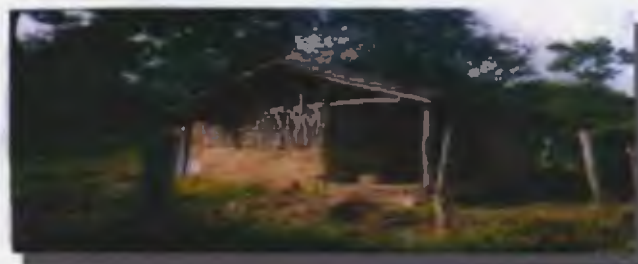
Vivienda tradicional de la comunidad